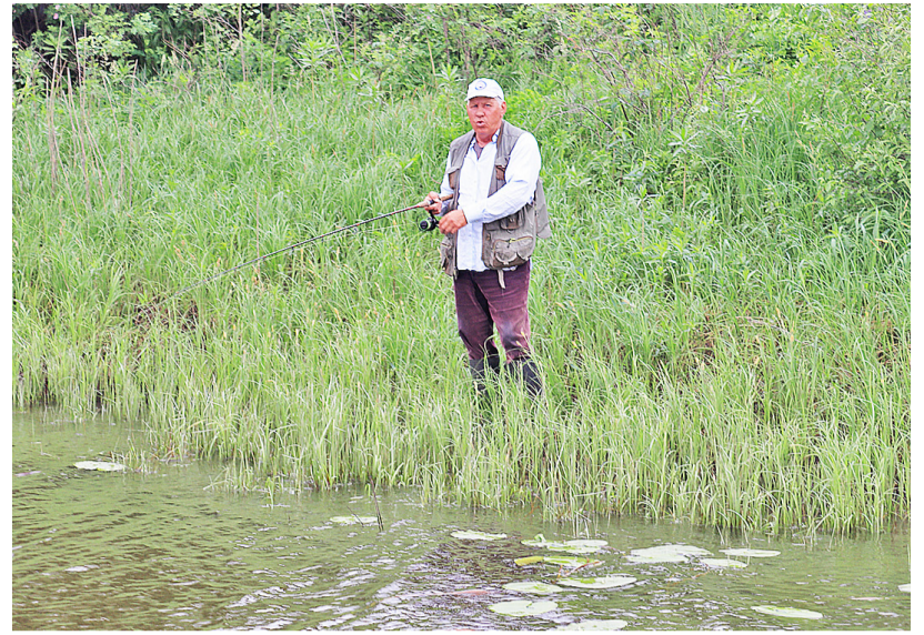
В нерестовый период рыбачить можно, но только с берега

За нарушение Правил рыболовства предусмотрена административная ответственность по ч. 2 ст. 8.37 КоАП РФ, предусматривающей наложение штрафа в размере от 2000 до 5000 рублей с конфискацией орудий лова и транспортного средства. Также граждане могут быть привлечены к уголовной ответственности по статьям УК РФ 256 (незаконная добыча водных биоресурсов) и 258.1 (незаконная добыча, содержание, приобретение,