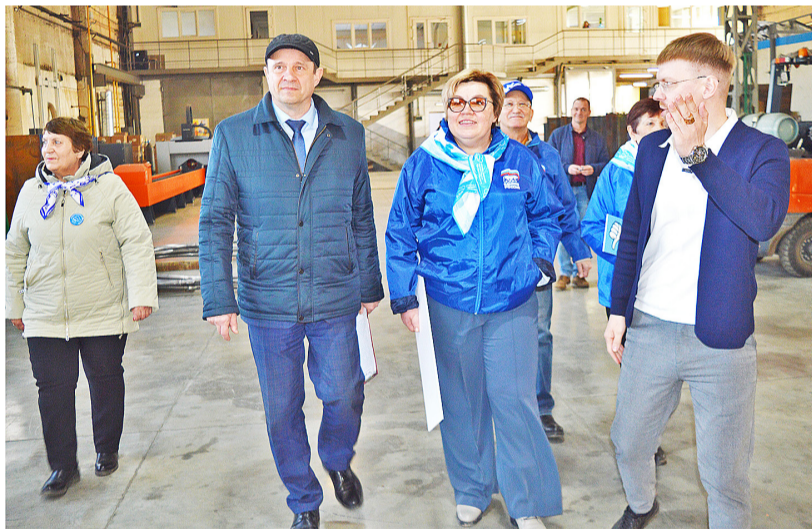
У промышленного предприятия «Авагро» большие перспективы

Члены народной комиссии оценили инвестиционные проекты, которые были запущены в действие в последние годы на территории Казанского округа в рамках реализации национального проекта по направлению «Экономика и промышленность» и Народной программы ЕР. Среди объектов – предприятие «Авагро», кафе «Блинка», мини-пекарня, суши-студия, автомойка.