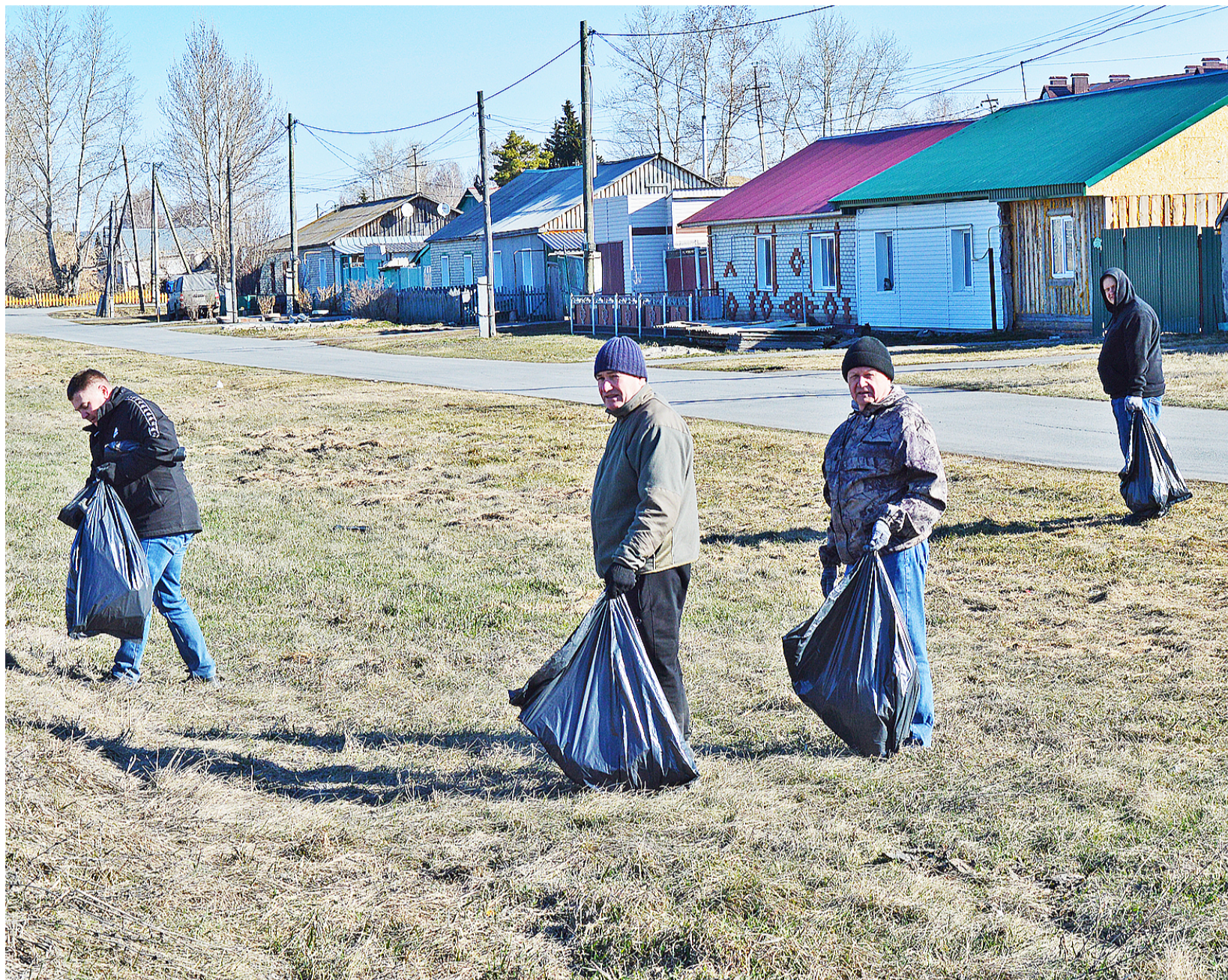
А вы присоединились к Всероссийской акции «Мы за чистоту»?