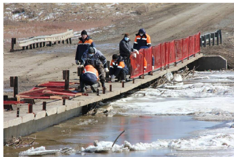
Дорожники снимают перила с Балаганского моста

Дня через два мост скроет и переправа будет, как всегда, проводиться на моторной лодке. На ней же мы доставляем продукты питания, по мере поступления заявок. Тяжёлые