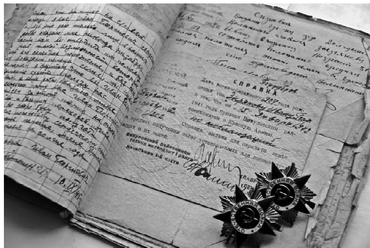
Письма Ивана Зырянова