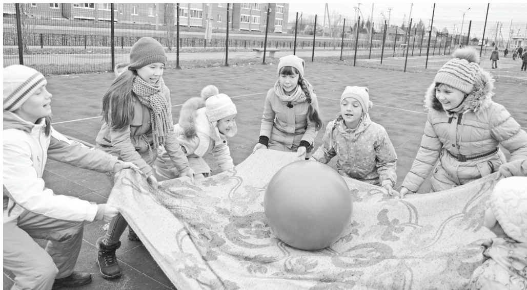
Классная новая игра!

Все получили такой заряд энергии! А ещё мы организовали чай в перерыве! Никто не отказался, за добавкой бежали! Какую цель преследовали? У нас футбо-