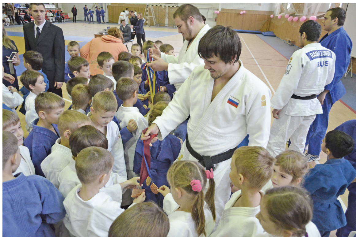
Каждому хочется дотронуться до медали кумира, пожать ему руку.

Спустя 12 лет (с момента открытия первой секции) этим видом единоборств в районе занимается 150 человек. Воспитанники Нижнетавдинской спор-