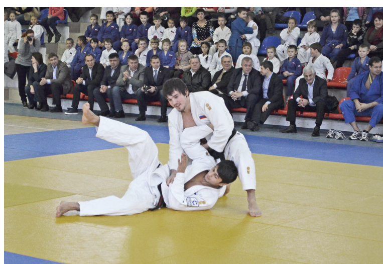
Когда на татами мастера, то это всегда красиво – и броски, и падения.

и кто-то должен был победить. В данном случае победа осталась за нижнетавдинцами.