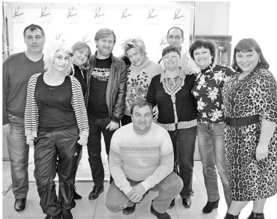
Фото на память с известным КВН-щиком Андреем Рожковым.

Подведены итоги районного конкурса детских рисунков. В конкурсе приняли участие юные читатели из 12