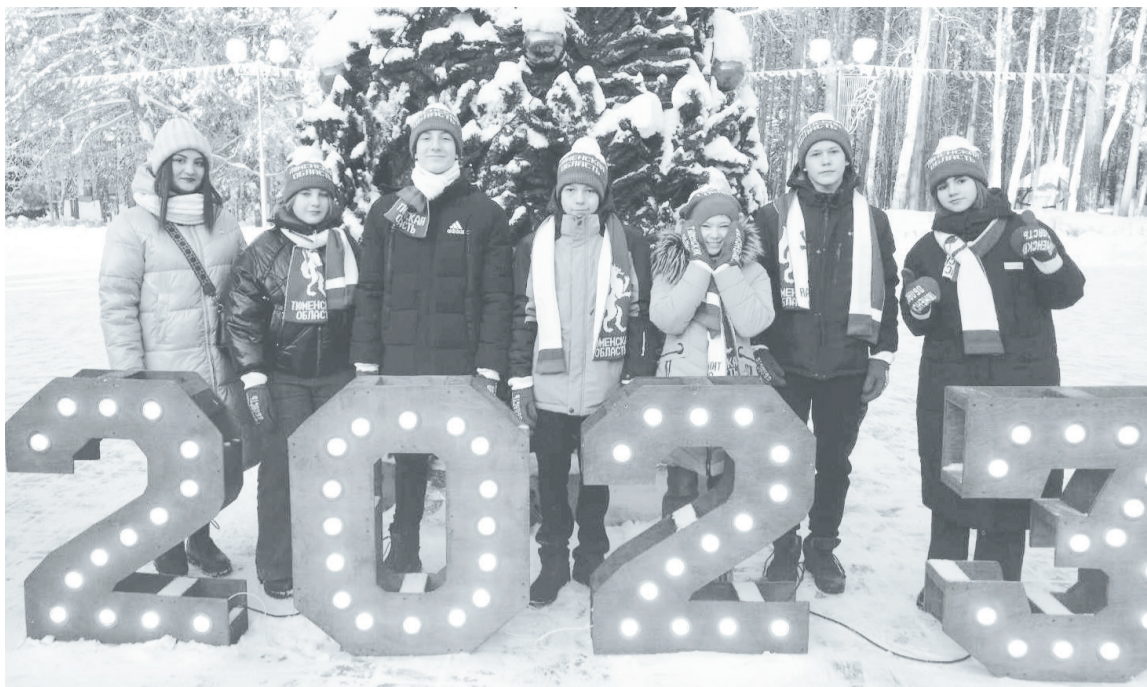
На главной ёлке региона упоровские школьники-лидеры.