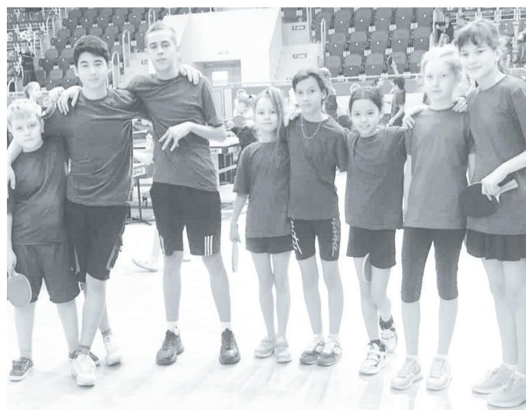
Упоровские теннисисты на «Тюменском меридиане».