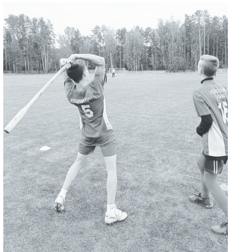
Упоровские лаптисты на XXVI Спартакиаде учащихся Тюменской области.