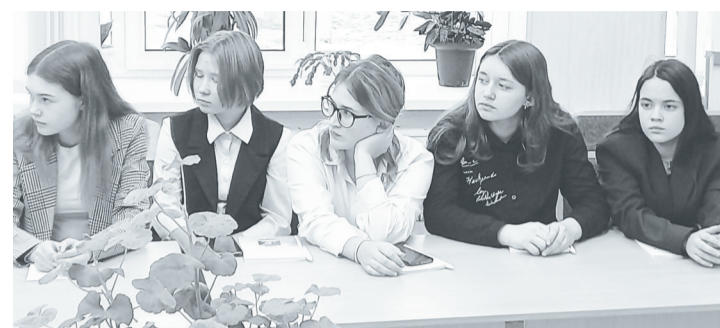
Школьники внимательно слушают предпринимателей.

Подготовила Диана ТАРКОВА.