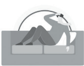
СОБЛЮДАЙТЕ ПОСТЕЛЬНЫЙ РЕЖИМ