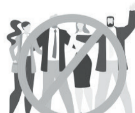
ОГРАНИЧЬТЕ ПРЕБЫВАНИЕ В МЕСТАХ СКОПЛЕНИЯ ЛЮДЕЙ