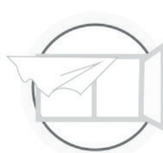
РЕГУЛЯРНО ПРОВЕТРИВАЙТЕ ПОМЕЩЕНИЕ