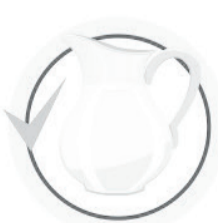
ПЕЙТЕ БОЛЬШЕ ЖИДКОСТИ