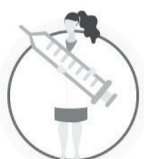
СДЕЛАЙТЕ ПРИВИКУ ОТ ГРИППА