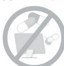
НЕ ЗАНИМАЙТЕСЬ САМОЛЕЧЕНИЕМ