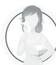
ИСПОЛЬЗУЙТЕ ОДНОРАЗОВЫЕ САЛФЕТКИ ПРИ КАШЛЕ И ЧИХАНИИ