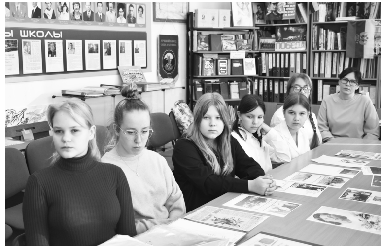
Семиклассники стали участниками классного часа, смотрели фильм о Валерии и познакомились с ее письмами