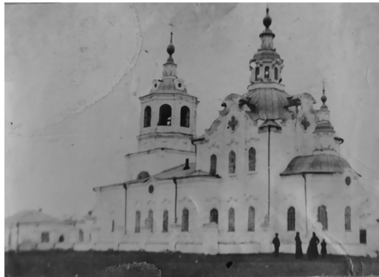
До 1938 года одно из лучших зданий в селе - церковь