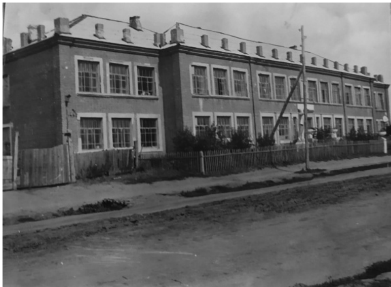
Таким было здание средней школы в Бердюжье

магазин, а в селе Окунево и деревне Кутырево были организованы книжные полки.