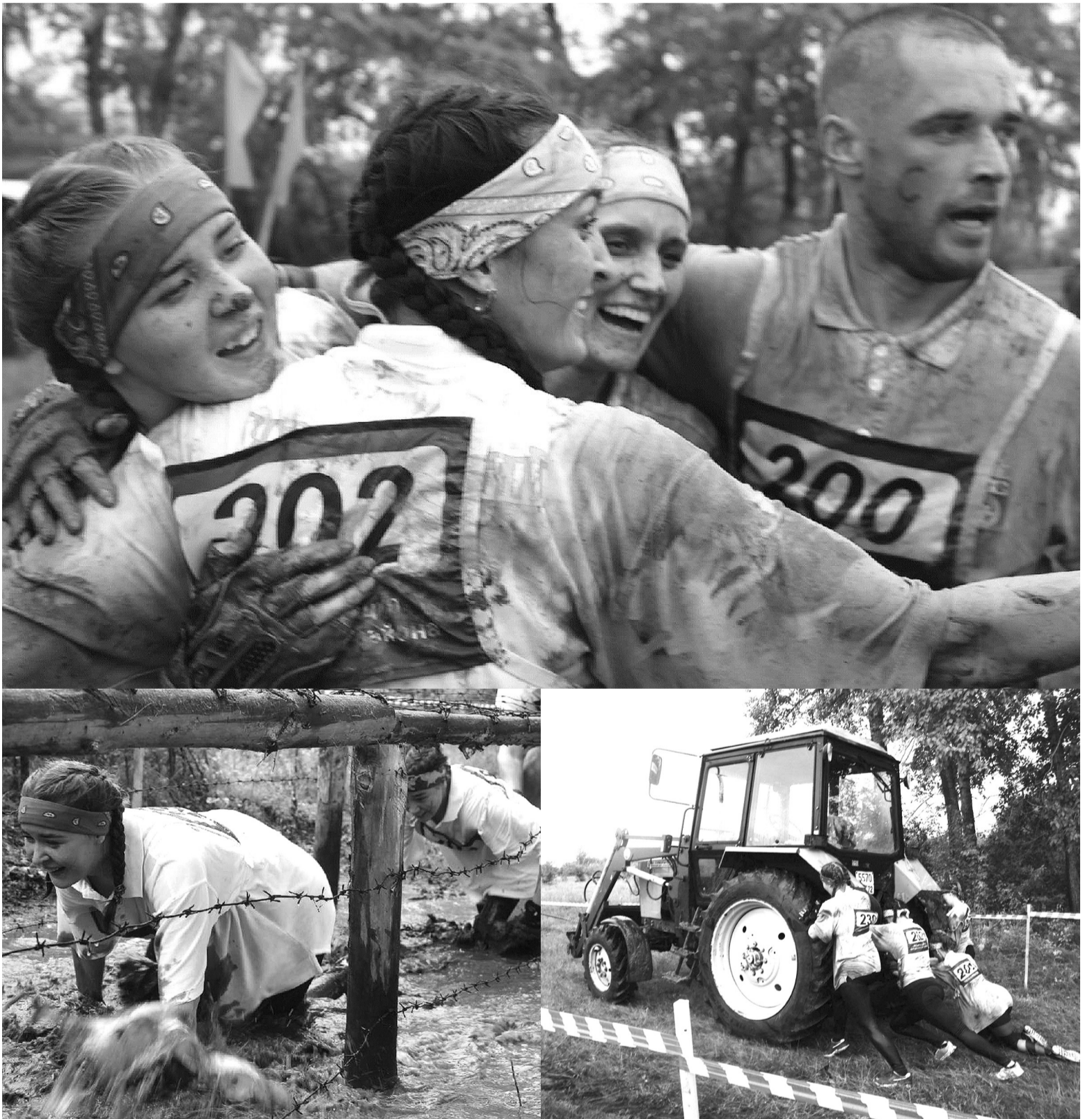
На фотоколлаже из снимков Анастасии Гацаевой фрагменты марафона "Путь к победе"

этапе – упорнейшая борьба. В трясине сладковских болот болевщички и гости из других районов активно поддерживали свои команды.