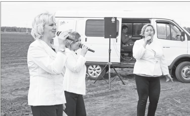
■ Специалисты Нижнетавдинского передвижного культурного комплекса провели выездной концерт для работников сельского хозяйства.

трудничестве, в рамках которого Россия будет поставлять зерно в Китай на сумму 1,9 трлн руб., но мы понимаем, как тяжело это реализовать на практике.