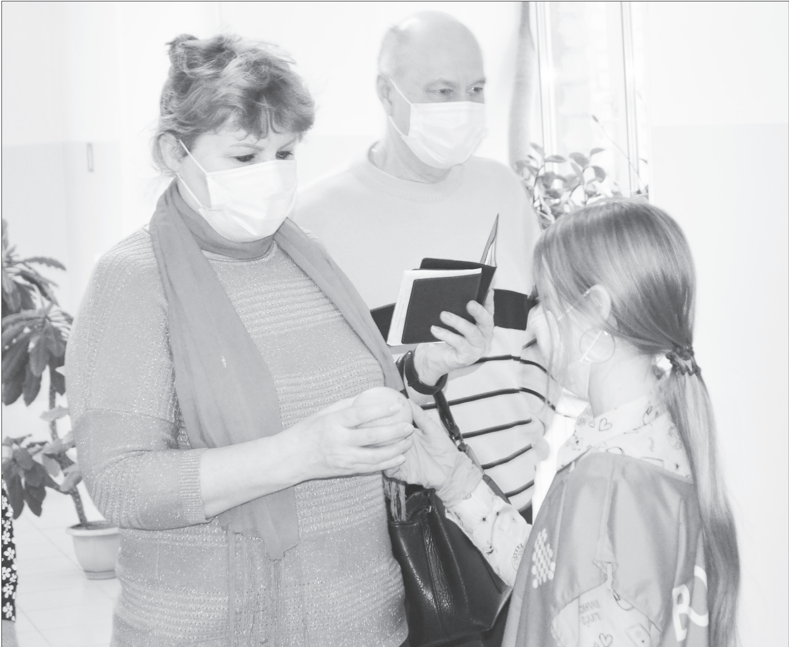
■ Волонтерская акция в ОБ №15 с. Нижняя Тавда. Активное включение детей и подростков в социально значимую деятельность помогает им стать здоровыми членами общества.

Дети – наше отражение. Психологи говорят, что в современном обществе наблюдается утрата контактов молодого поколения со старшим. Да,