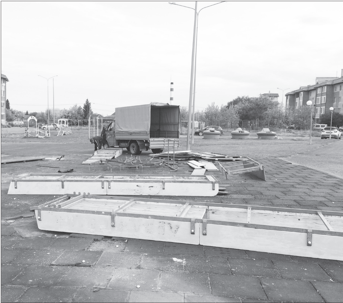
■ Идёт демонтаж детской площадки.

В дальнейшем была проведена оценка в соответствии с методикой начисления баллов по каждому конкурсному критерию, в результате чего первый проект признан