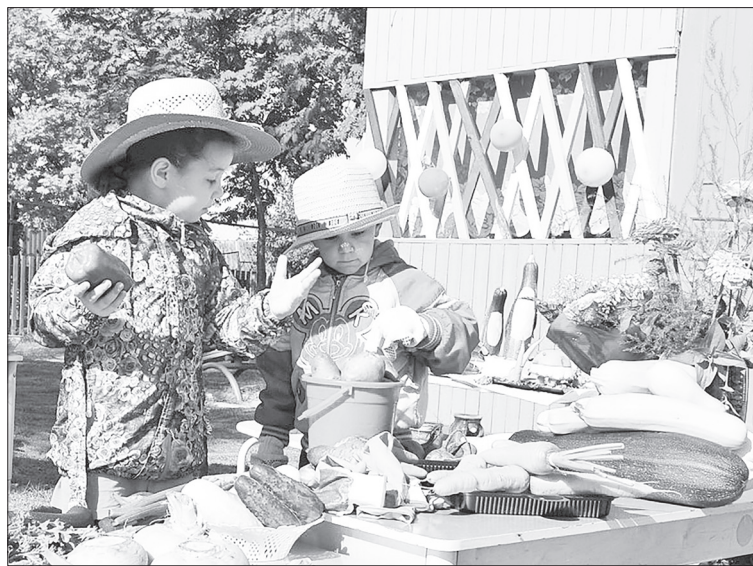
Воспитанники детского сада и их небывалый урожай.

быкновенные снеговые фигуры. Мы неоднократно сами наблюдали весь процесс, когда дети старательно сгребают снег, оформляют фигуры, рисуют их. Конечно же, без помощи родителей тоже не обходится.