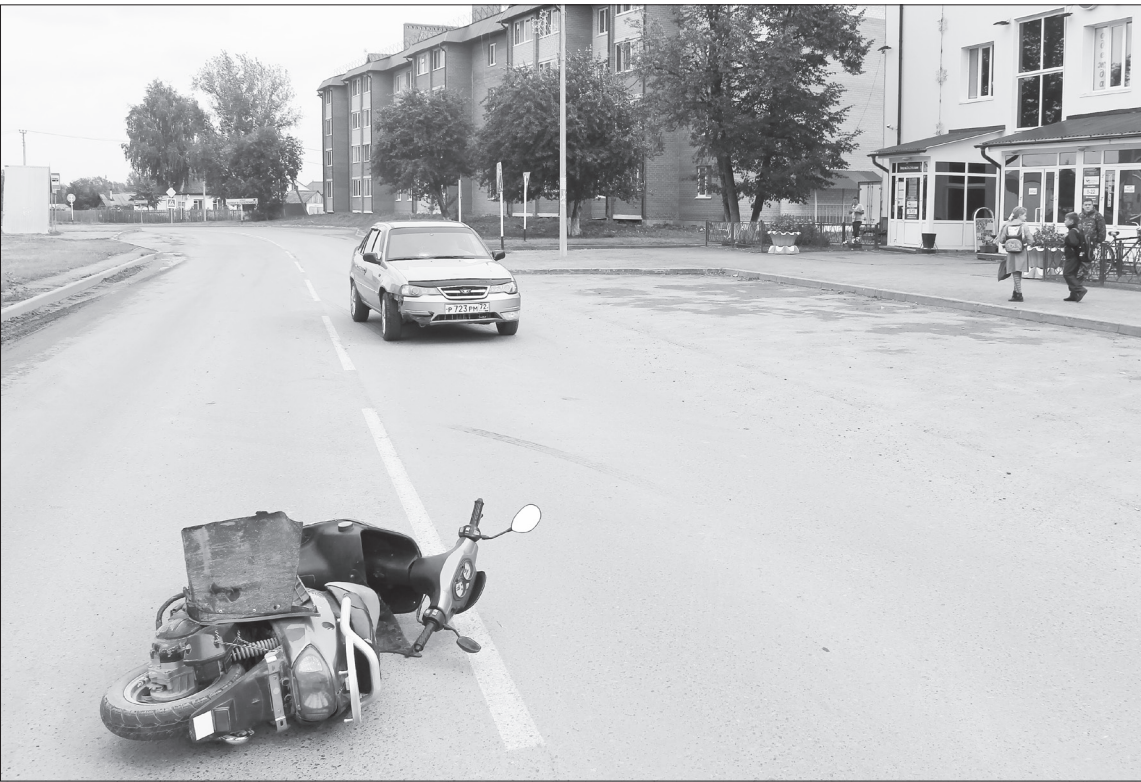
ДТП на улице Ленина в Нижней Тавде.

Ветер в ушах свистит. На первый взгляд кажется, что самокат безопасен – и для водителей, и для других участников дорожного движения. Но современные электросамокаты могут развивать скорость от 20 до 75 километров в час, а то и больше. Такой же скорости достигают мопеды и скутеры, но на них, в от-