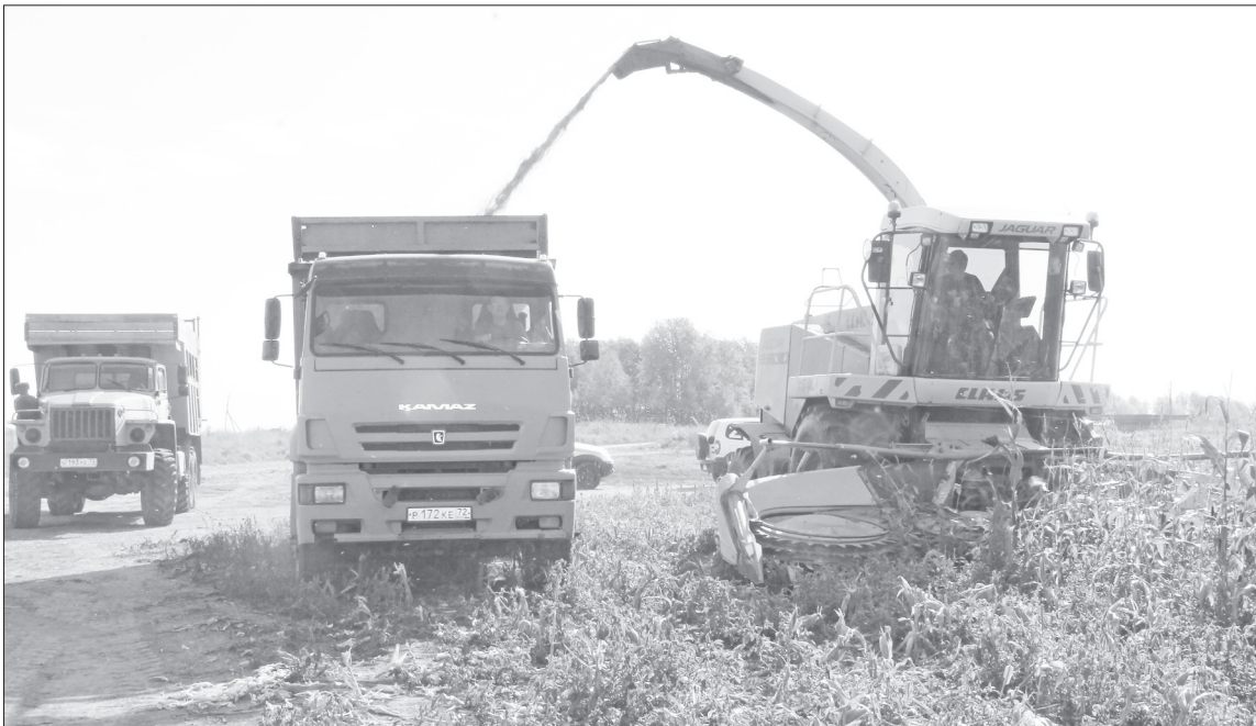
■ Продолжается уборка кукурузы на полях агрохолдинга «Нижнетавдинский».

В связи с событиями в мире. Группа компаний «Новый Сухопутный Зерновой Коридор» и китайская госкорпорация договорились о со-