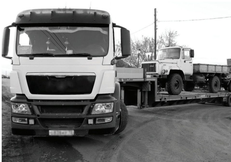
В Сладковском районе поддержке участников СВО уделяется особое внимание.

Отметим, что Сладковский район с самого начала специальной военной операции не остаётся в стороне. Сбор гуманитарной помощи, приобретение необходимого оборудования для бойцов СВО,