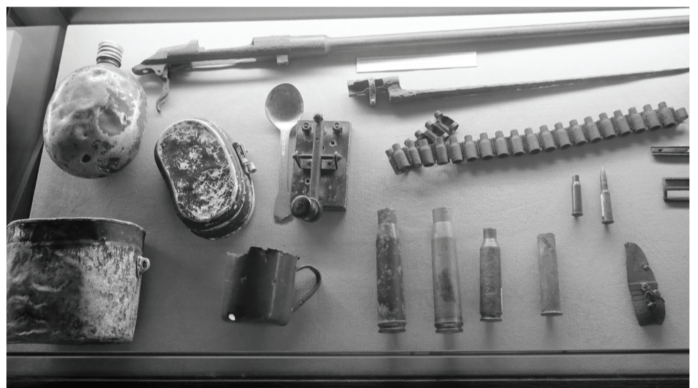
Зал боевой славы – основная база патриотического воспитания, которая приближает к духовным ценностям все поколения.