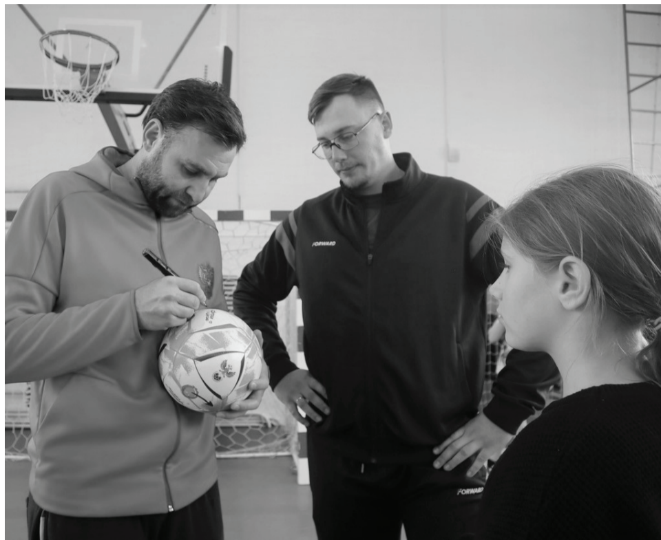
В ходе мастер-класса школьники узнали много нового и полезного, а также смогли задать вопросы титулованному спортсмену.

– Проект состоит из пяти элементов: футбольные уроки физкультуры, организация на базе школ секций, обучение и поддержка учителей, проведение Всероссийского фестиваля «Футбол в шко-