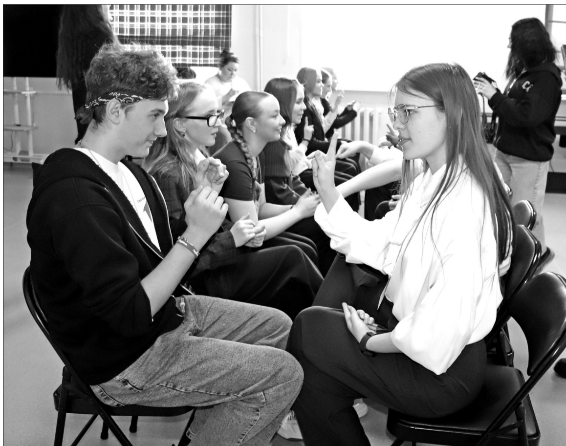
📷 Участников конкурса «Лидер XXI века» на мастер-классе переговоров учили общаться и решать проблемы.

Ребята, разбившись на пары, азартно пытались решить задачи, поставленные приглашёнными экспертами. Парни и девчата были в положении учеников и учителей, подчинённых и начальников. Порой приходи-