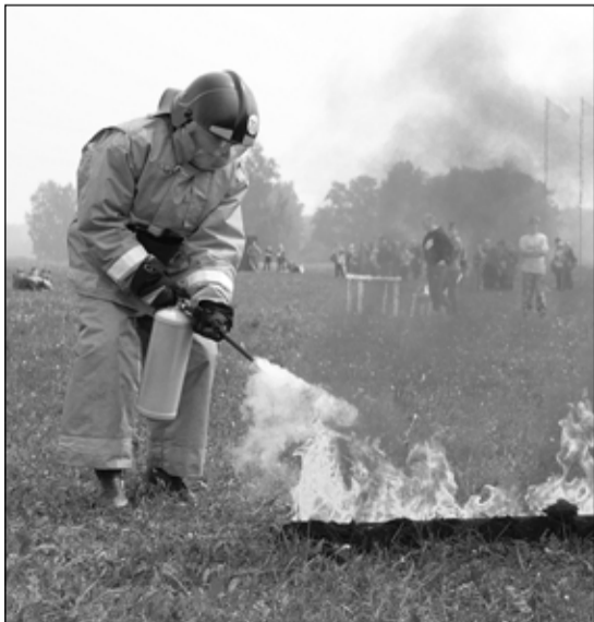
Пожар – дело нешуточное