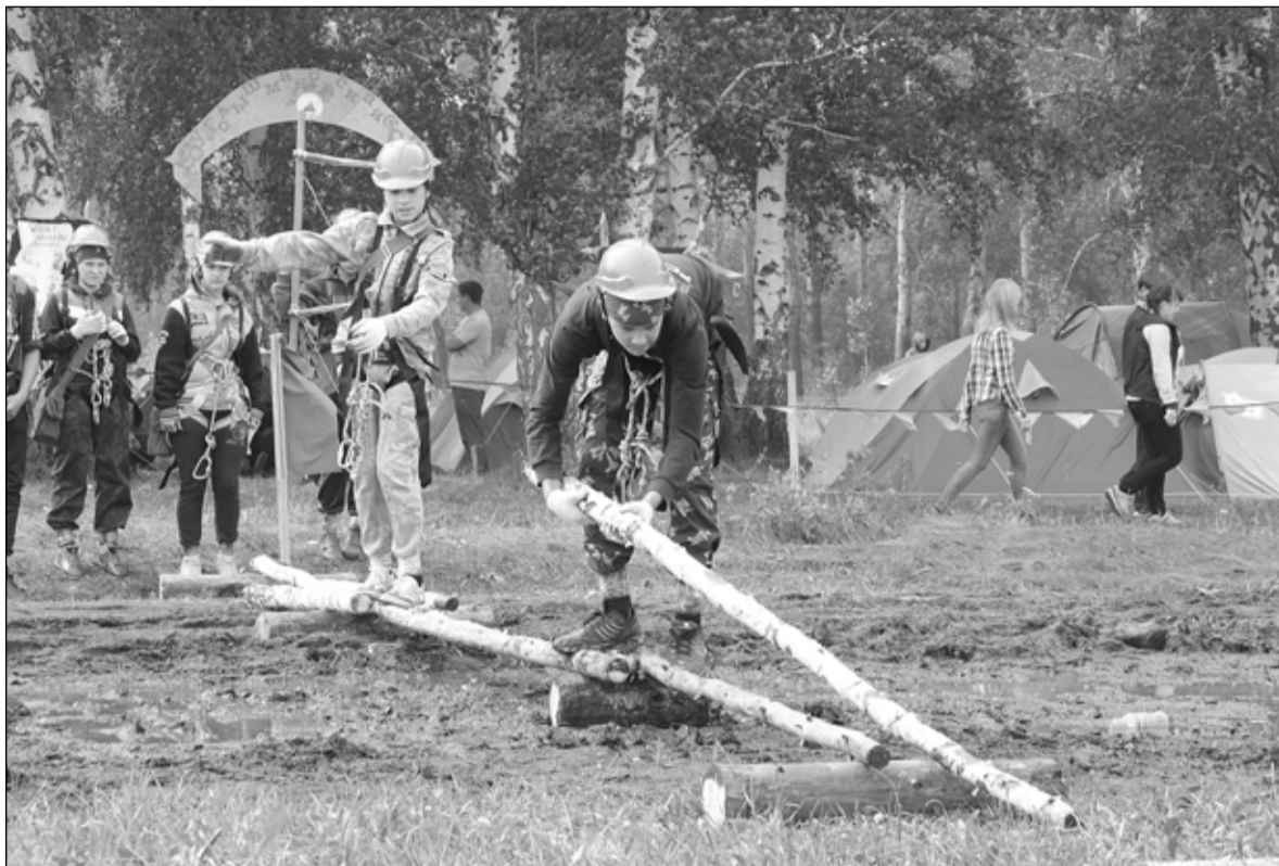
«Переправа, переправа! Берег левый, берег правый...»