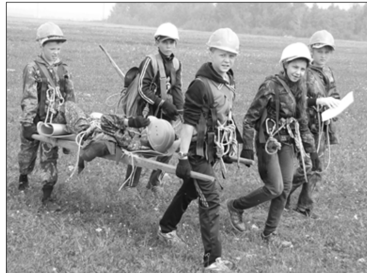
Турист в походе должен уметь оказывать первую медицинскую помощь