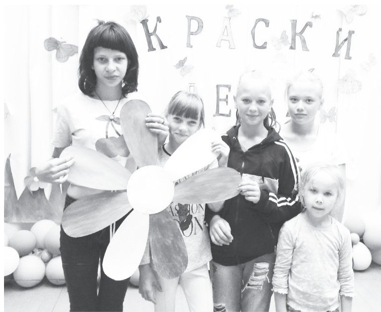
В ходе развлекательной игры дети собрали семичетик.

проводили с детьми профилактические беседы о правилах поведения у воды, личной гигиены, безопасного обращения с огнём.