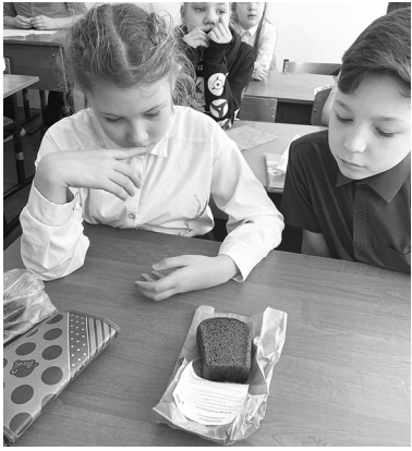
Мерило жизни – хлеб. Об этом говорили в школах округа

Поэтесса Ольга Берггольц, пережившая военную блокаду в «колыбели революции», написала в своей героической «Ленинградской поэме»: