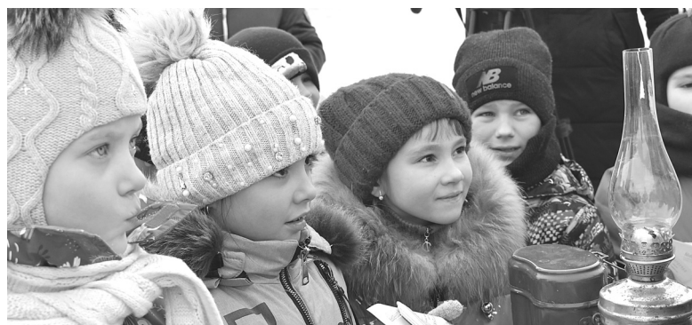
Блокаду Ленинграда переживали сотни тысяч детей – сверстников нынешних школьников

вокал – живёт он в Черемшанке. Задержался, чтобы поздороваться с участниками акции – сам раньше работал в школе и не раз принимал участие в патриотических мероприятиях. С сыном-семиклассником обязательно попробуют блокадный хлеб, вспомнят о фронтовиках.