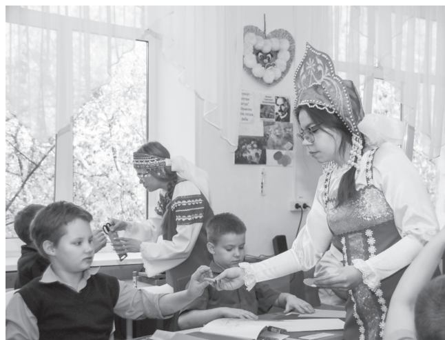
Первое занятие по проекту «Творческая мастерская «ЭтноМир» прошло в атмосфере совместного творчества, радости от соприкосновения с народными традициями.

В рамках проекта планируется проведение мероприятий: «Жизнь и быт татарского народа», «Украинские сказки и напевы», «В гостях у казах-