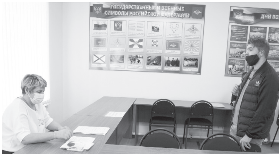
На входе у призывников измеряют температуру, обрабатывают руки и, если необходимо, выдают маску. Нет и очередей: у каждого кабинета — по одному ожидающему.