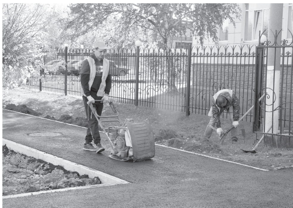
Финальные штрихи: дорожные строители поднимают водопроводные и водоотводные смотровые колодцы на уровень дороги, выполняют устройство тротуаров.

Параллельно ДРСУ-5 выполняет ремонт участка дороги по ул. Артиллерий-