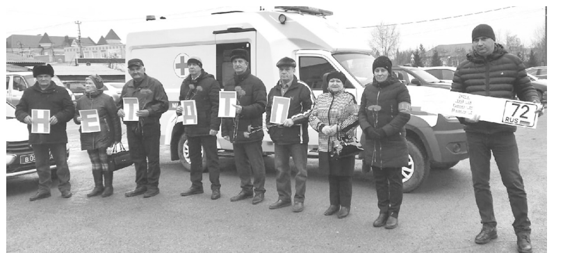
Голышмановские добровольцы на акции памяти

Елена СОНИНА