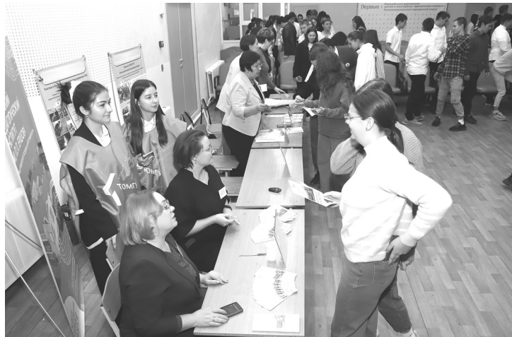
Почти 500 старшеклассников побывали на ярмарке. Ребята с интересом расспрашивали представителей заведений профессионального образования и участвовали в мастер-классах Ишимского медколледжа