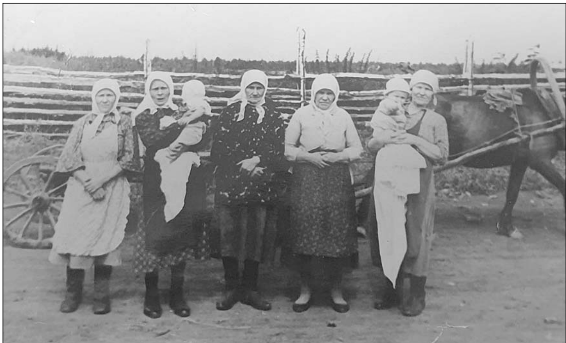
• Жительницы деревни Большой Кусеряк. Снимок сделан в 30-е годы прошлого столетия.