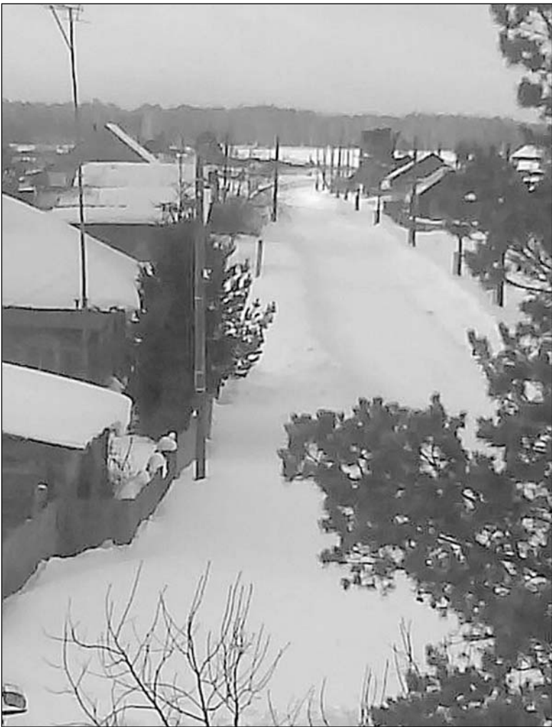
• Улица Большого Кусеряка в настоящее время.