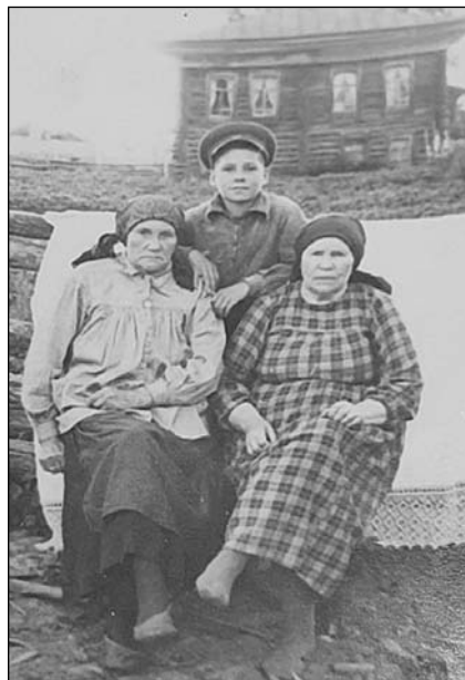
• Семья Сухининых. На втором плане церковно-приходская школа, 1902 года постройки.