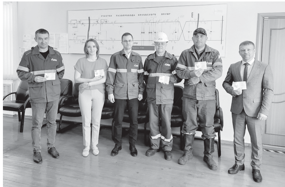
Коллектив КС-10 – участники акции «Я выбираю ГТО»

- Мы проводим акцию под названием «Я выбираю ГТО». Наши инструкторы приходят на предприятия и в организации, беседуют с сотрудниками, рассказывают о движении ГТО, агитируют. Затем назначается день, когда работ-