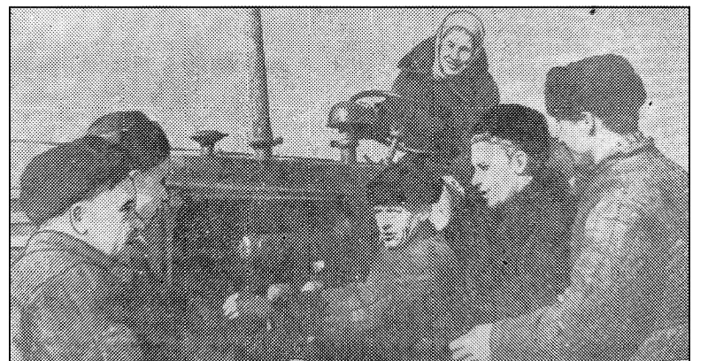
Колхозные механизаторы принимают трактор, переданный из МТС. «Дефектов не обнаружено», – гласит подпись под снимком.