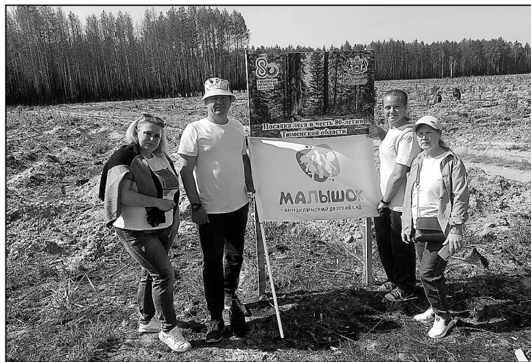
Представители детского сада «Малышок» с флагом у стенда акции.

Акция, приуроченная ко Дню России, завершила череду мероприятий по лесовосстановлению,