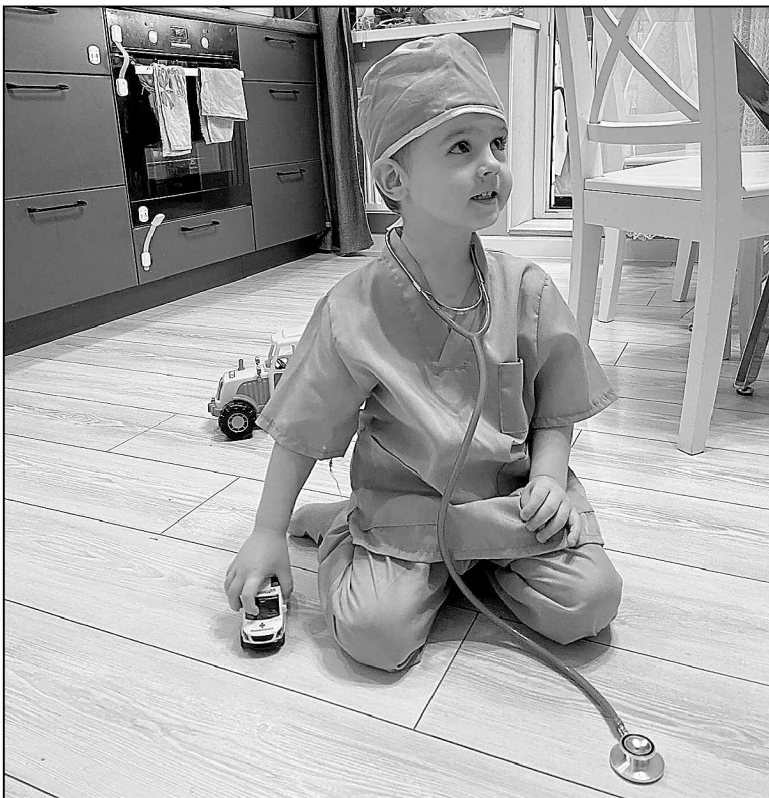
А сынишка пока только играет во врача.