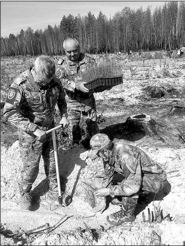
Ветераны СВО готовы выполнять и эту поставленную задачу.