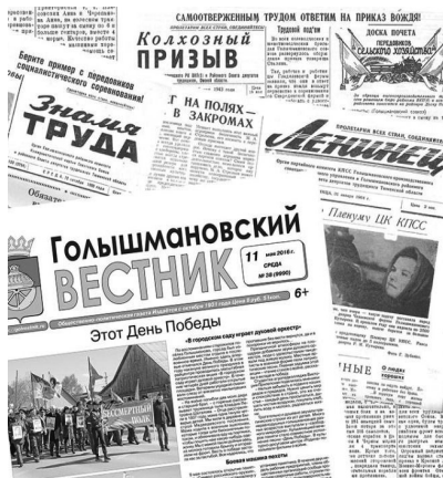
Нашу газету переименовывали пять раз

Первый выпуск печатного издания вышел в конце октября 1931 года. Типографию разместили в новом кирпичном здании универмага на улице Базарной в посёлке Катышка. В стране создавались коллективные хозяйства. Газету назвали в духе времени – «Колхозный призыв».