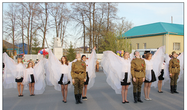
• Моменты празднования Дня Победы в Аромашево.