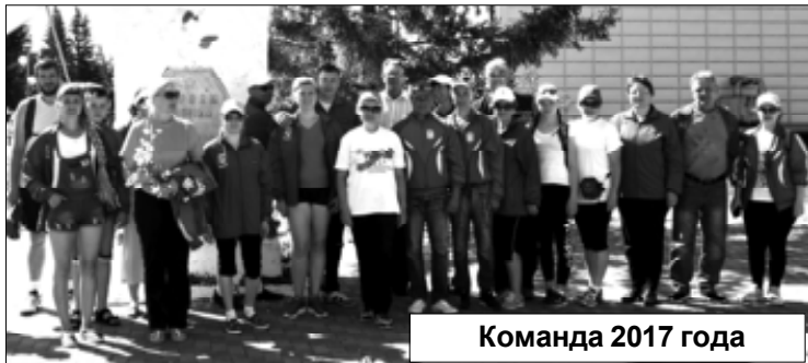
Команда 2017 года

Добавим, что в колонне были представители администрации района, Дома детского творчества, физкультурно-оздоровительного центра, здравоохранения и просто активные, поддерживающие здоровый образ жизни, люди. И еще – учитывая те факты, что команда получилась разновозрастной (от 14 лет и до 50 «с хвостиком») и лишь некоторая часть до этого устраивала тренировочные «покатушки», на весь круг (Армизонское – Армизонское) «замахнулись» немногие, а часть рассчитывала доехать хотя бы до Бердюжья... Однако, забегая вперед, отметим, командный дух, азарт и некоторая доля авантюризма подстегнули силу воли и даже физическую силу – как раз единицы, и лишь в силу непреодолимых обстоятельств, сошли с дистанции, и то – через полторы сотни километров – в Голышманово! А большинство, сами не ожидая того, доехали до финиша! Думаем, они заслуживают, чтобы их имена знали все: