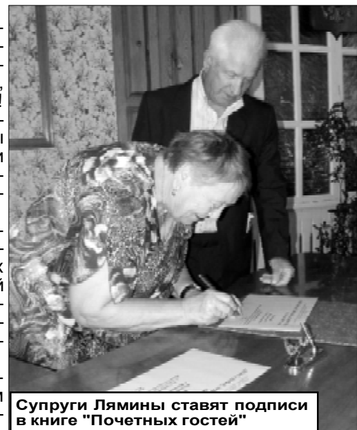
Супруги Лямыны ставят подписи в книге "Почетных гостей"

Петра и Февронии, ведь счастливая семья – это крепкая Россия!