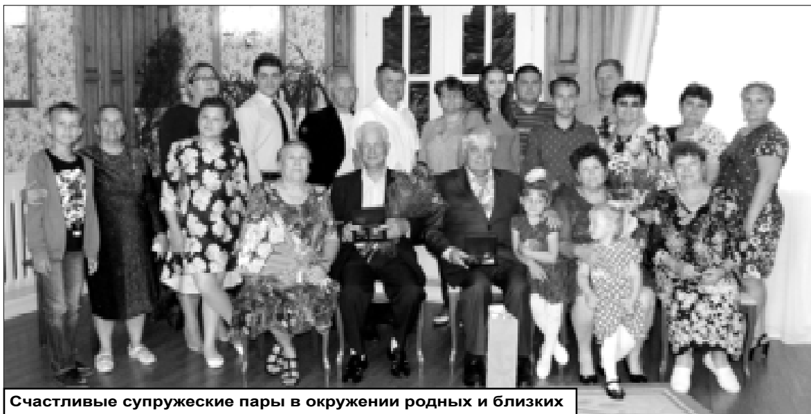
Счастливые супружеские пары в окружении родных и близких

Более 780 лет 8 июля является православным днём почитания святых князей Петра и Февронии Муромских. Ещё при жизни эта пара стала образцом взаимной любви, верности и семейного счастья. Согласно древнерусской легенде, они жили душа в душу и умерли в один день – 25 июня 1228 года по старому стилю (8 июля – по новому). Их чудотворные мощи покоятся на территории женского монастыря в городе Муроме. Они помогли огромному количеству верующих по всему миру обрести семейное счастье, сохранить супружескую любовь и верность, а также обрести долгожданное материнство отчаявшимся женщинам.