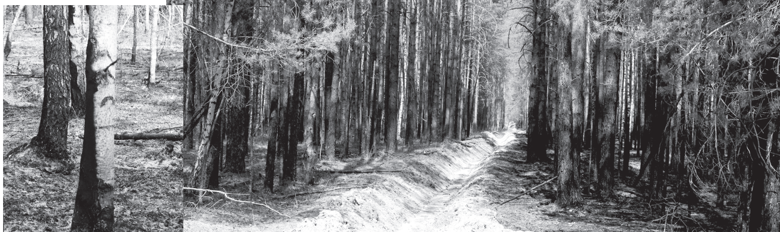
15 мая в Юргинском районе ликвидирован крупнейший на территории региона лесной пожар. Борьба с огнём, распространяющимся по болотистой местности, шла почти две недели