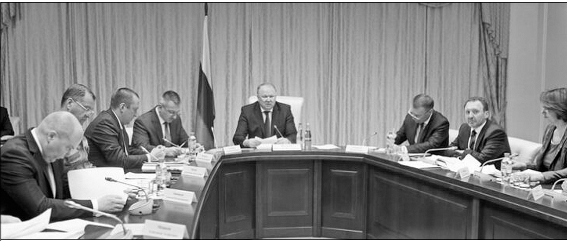
Полпред Николай Цуканов провел окружное совещание.