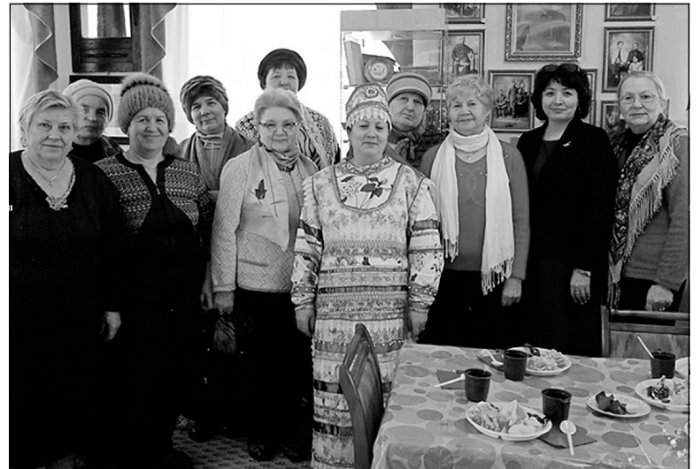
Члены клуба «Вдохновение» в музее Ембаево.