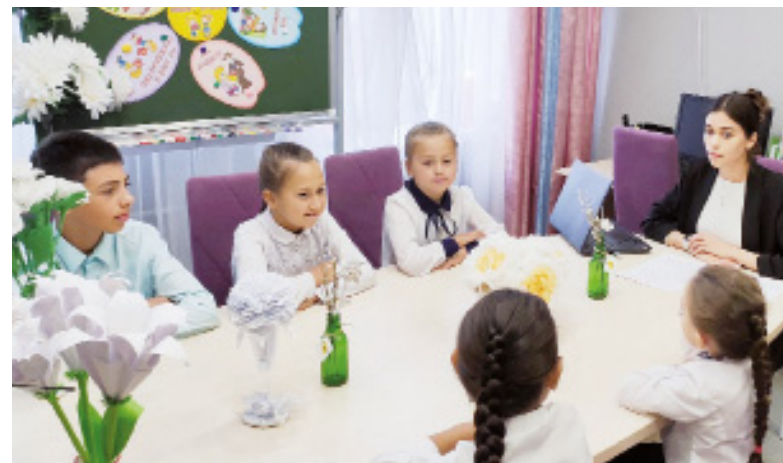
► Уроки милосердия в «Доме детства»

И уроки милосердия, где ребята под руководством педагогов мастерили бумажные цветы, стали важной частью благотвори-