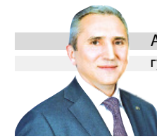
АЛЕКСАНДР МООР губернатор Тюменской области