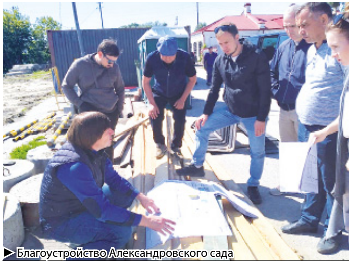
▶ Благоустройство Александровского сада