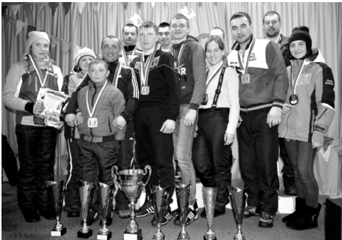
Команда Орловского сельского поселения

Первое марта многим жителям района запомнится не только началом весны, но и большим спортивным событием – XXIX районными зимними сельскими спортивными играми – центром которого стало село Капралиха.