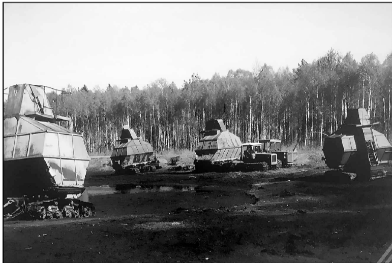
Заготовка торфа на полях Тюменского района.