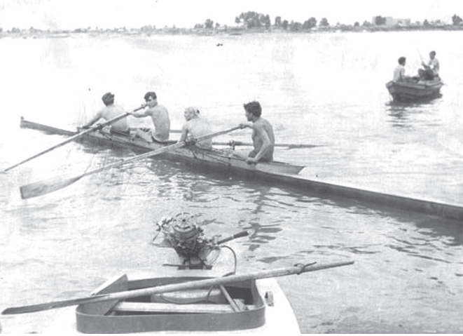
✎ Учебный процесс в акватории Оби