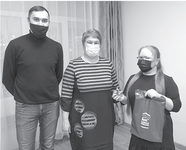
Вручили партийные билеты новичкам

Среди новобранцев партии – люди самых разных профессий: учителя и студенты, предприниматели и социальные работники. Это те, кто принимает осознанное решение о вступлении в партию «Единая Россия», те, кто хочет стать не сторонним наблюдателем, а непосредственным участником политической жизни страны в целом и Тобольска в частности.