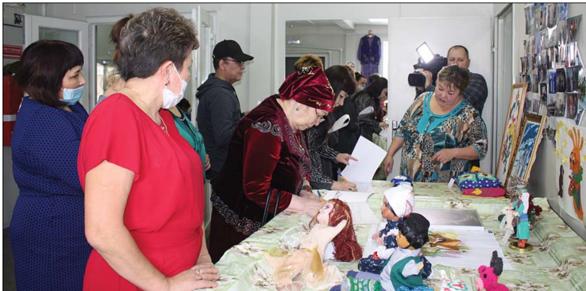
• Работы, представленные на конкурс декоративно-прикладного искусства, вызвали большой интерес.