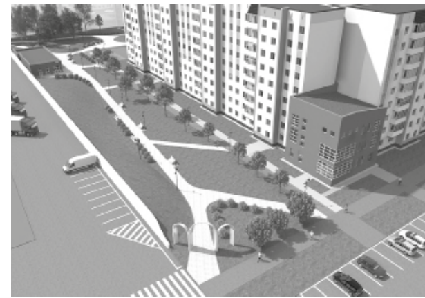
► Вариант №2

Чтобы в 7 микрорайоне появился сквер Выпускников, тобоякам нужно набрать 20,5 тысячи голосов. Пока новый проект благоустройства набрал лишь половину. Коллектив «Тобольской правды» не остаётся в стороне и не только информирует читателей о ходе голосования, но и активно участвует в нём сам.