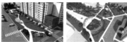
сквер Выпускников, 7 мкр.

ZA.GORODSREDA.RU С 15 АПРЕЛЯ ПО 31 МАЯ 2023