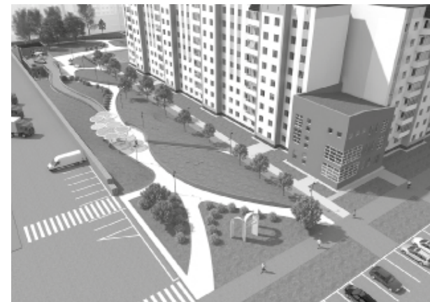
► Вариант №1

Тобольск вновь принимает участие во Всероссийском конкурсе лучших проектов создания комфортной городской среды в малых городах и исторических поселениях, который проводится под эгидой Минстроя России.