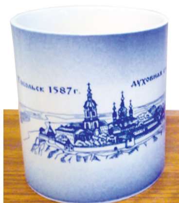
► Из фарфоровой мастерской

За приятной и неторопливой беседой взгляд вновь и вновь возвращается к буфету с фарфором, описывать который возможно только в превосходной степени!