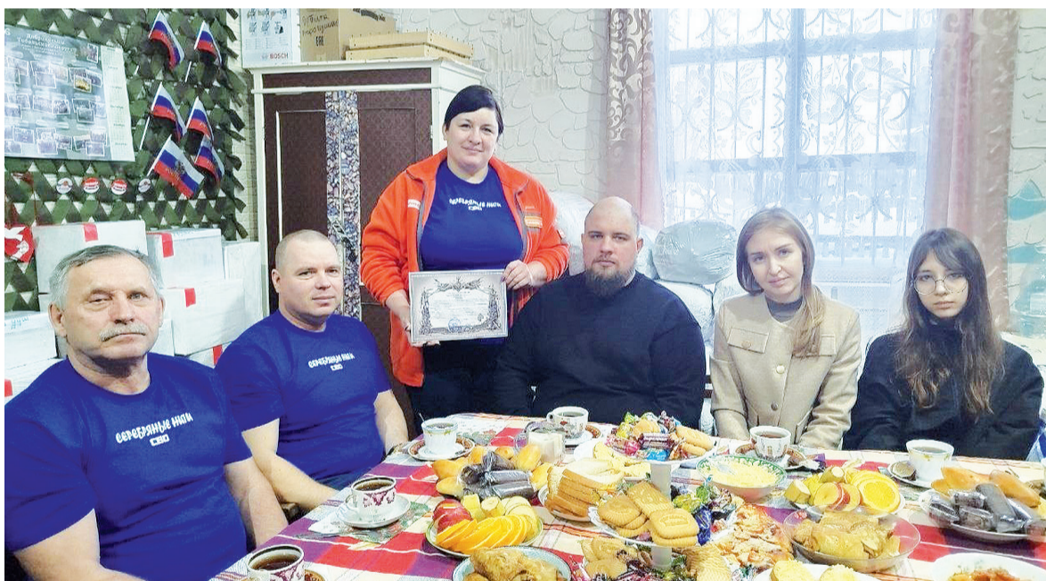
► На встрече с бойцом СВО в Ворогушино

и в заливке свечей: их залито 100 штук, кроме того, упаковали сухарики, связали носки для солдат.