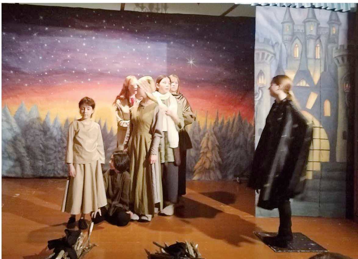
► Сцена из рождественского спектакля

Жизнь в обители подчинена строгому распорядку, молитве посвящается более шести часов в сутки. Но, помимо молитвы, все сёстры исполняют и ежедневные послушания. При обители содержится большое хозяйство и земля. Трудом монахинь