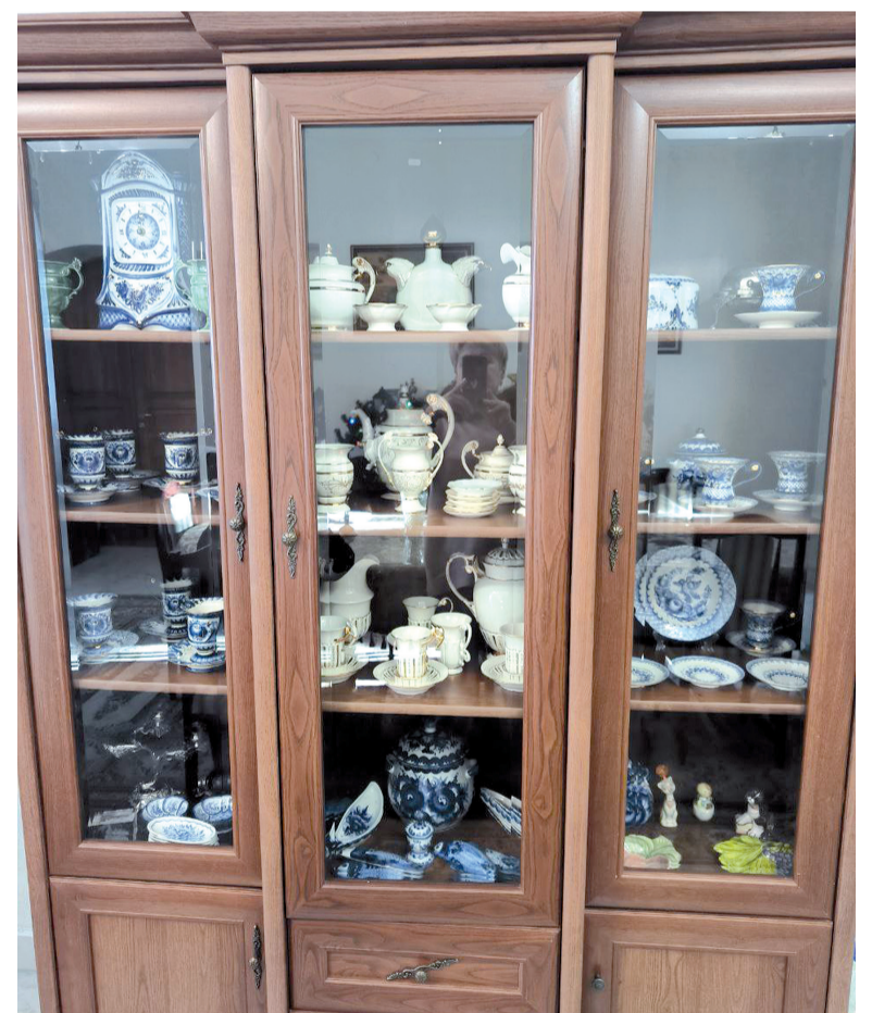
► Фарфор мастериц Иоанно-Введенского монастыря