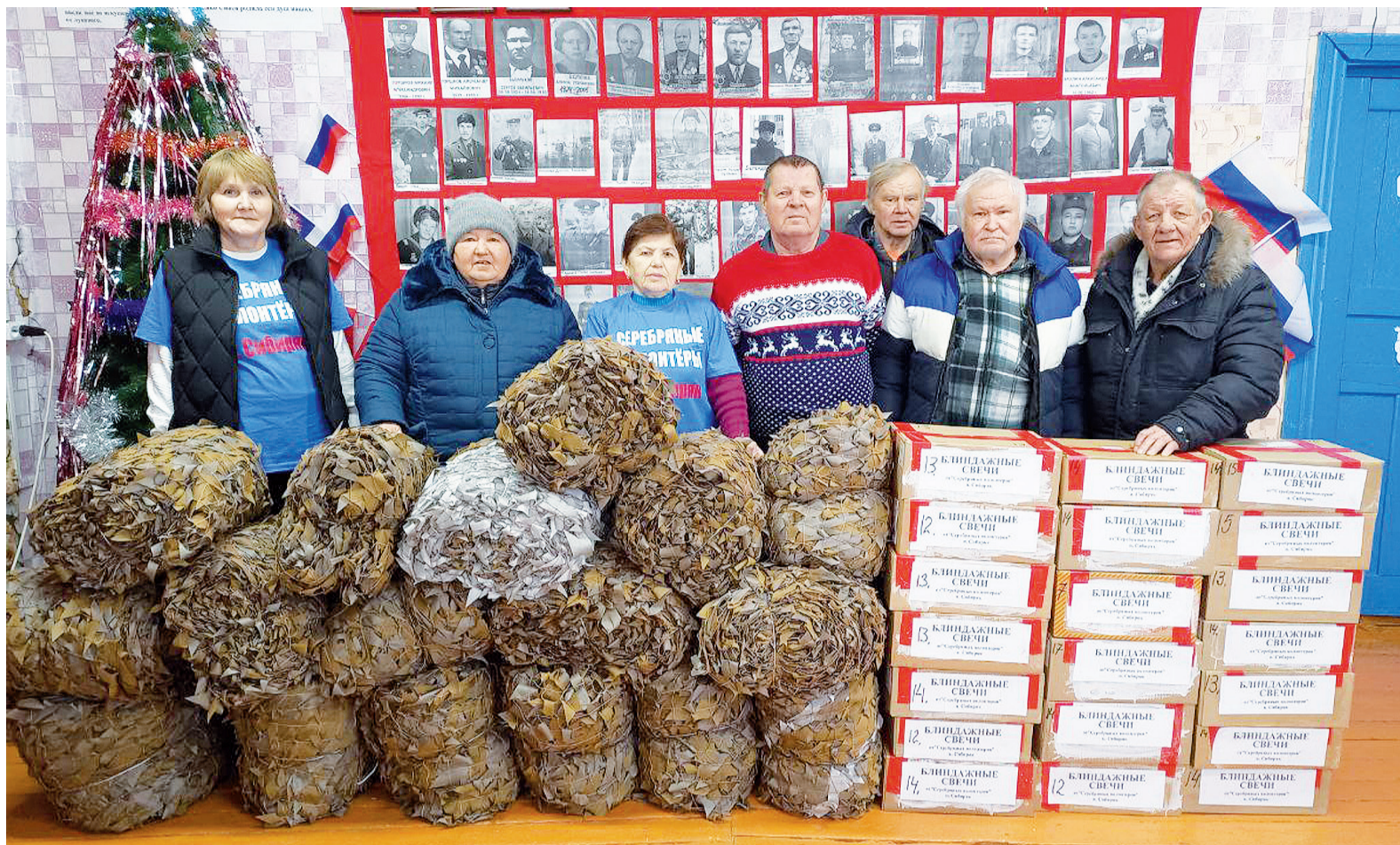
► Дружная и сплочённая команда волонтеров из Сибиряка

Так, уже к шестому января собрали первые в этом году посылки для военнослужащих серебряные волонтеры из Сибиряка. А между тем процесс плетения маскировочных сетей сибирякцы не прекращают ни на минуту. Сначала четыре, потом 8, 12, счёт необходимого на передовой защитного снаряжения растёт, кажется, не по дням, а по часам. Волонтеры подают пример своей скоростью и неугомонностью, что замечают в соцсетях их коллеги и, в свою очередь, спешат равняться на лидеров. А передовики-сибирякцы задают тон