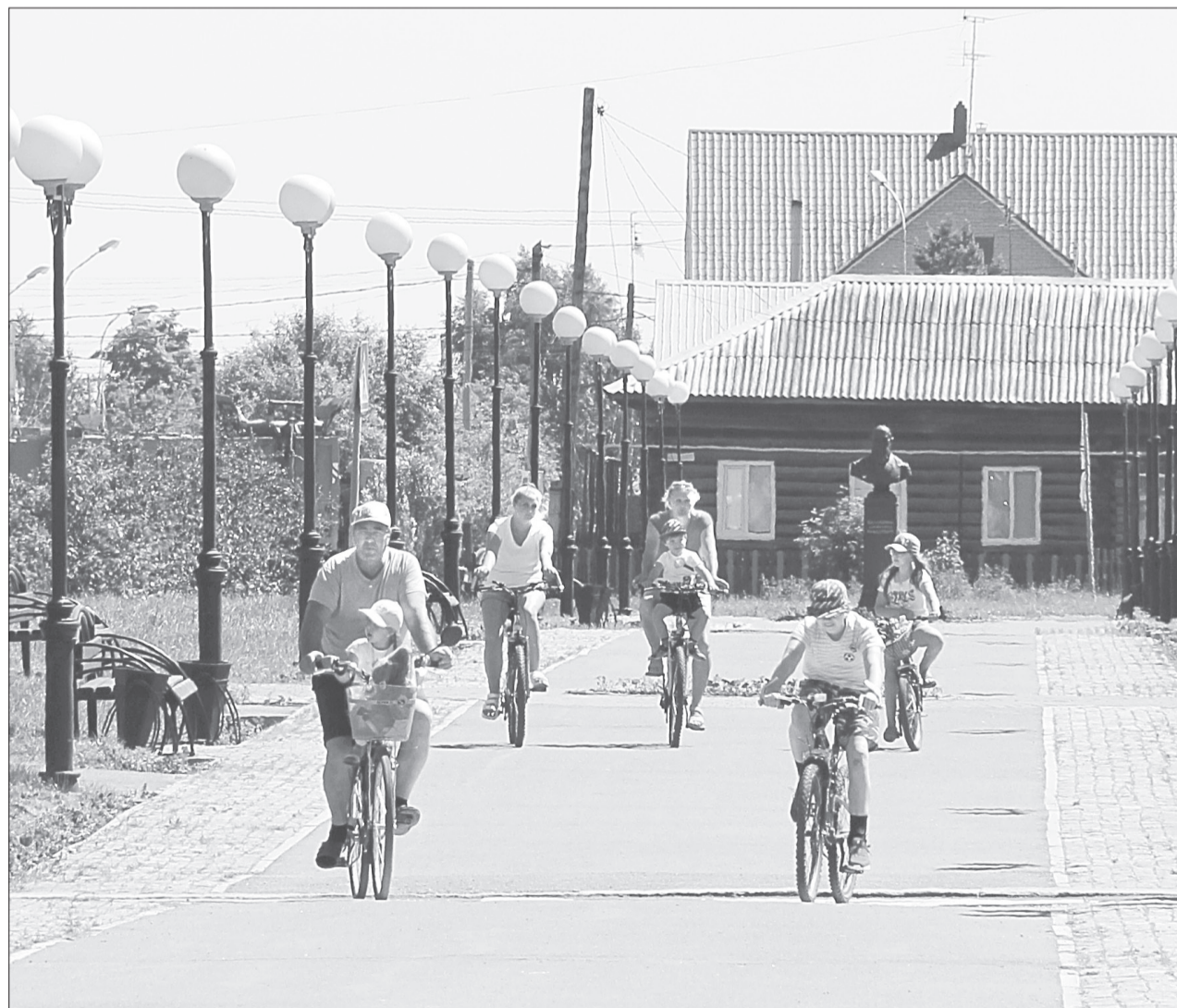
Нет лучше средства передвижения, чем велосипед! Ялуторовчане предпочитают душным автобусам двухколёсный транспорт