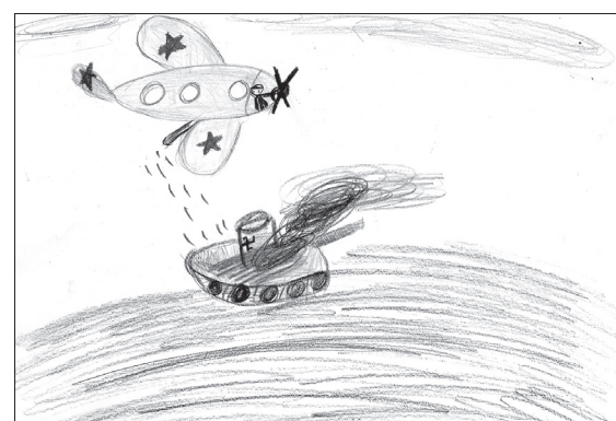
Софья МЯСНИКОВА, 6 лет