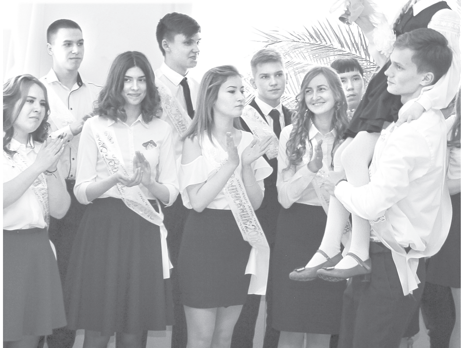
Последний звонок для выпускников школы им. Декабристов - звонок нового этапа жизни