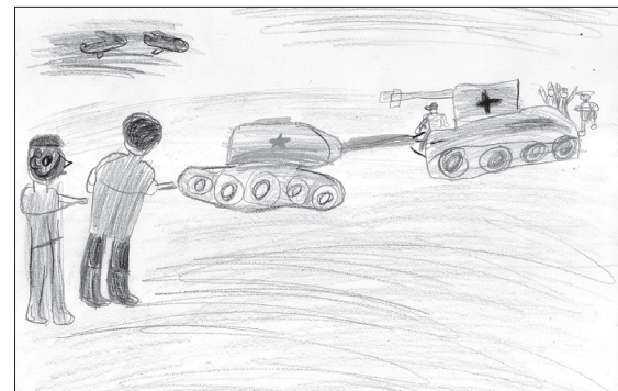
Маша МЕДВЕДЕВА, 6 лет