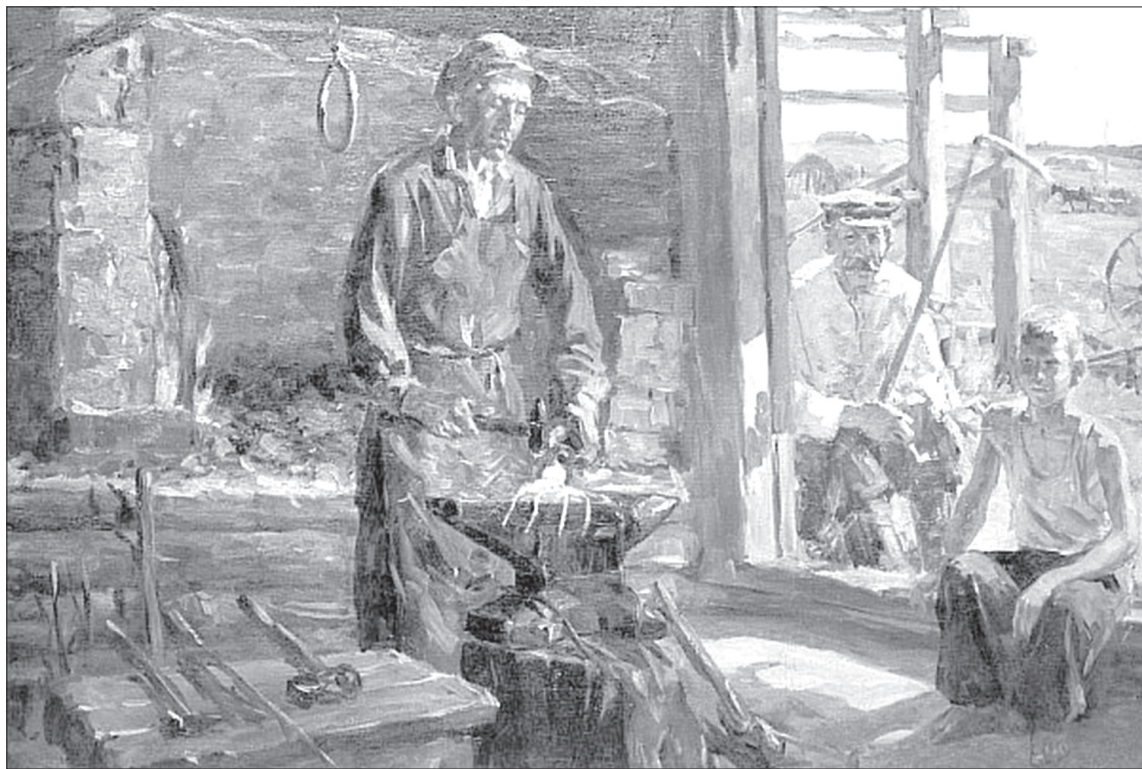
Во время войны деревенские кузницы были главным местом притяжения детворы

/КАРТИНА «СЕЛЬСКАЯ КУЗНИЦА». АВТОР МИХАИЛ КОРБАТОВ