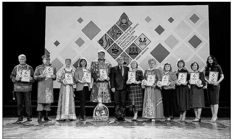
«Сибирь» получает награду.