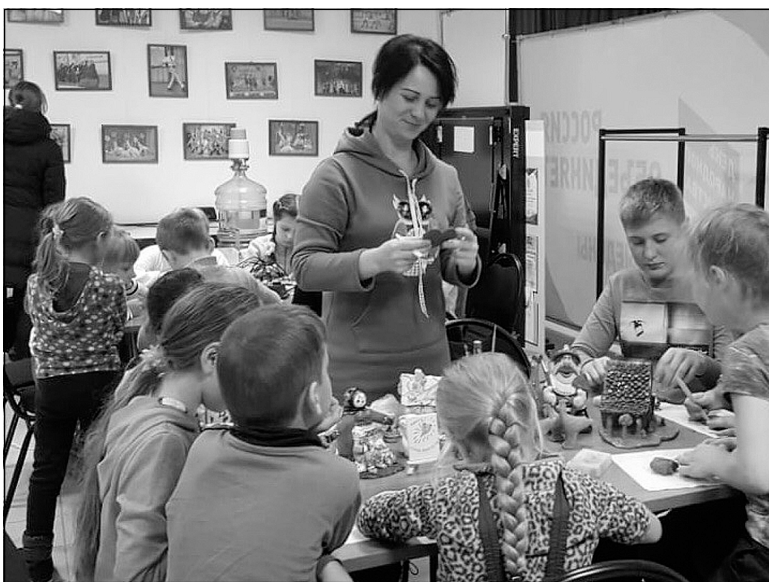
Мастер-класс в Новотарманском.