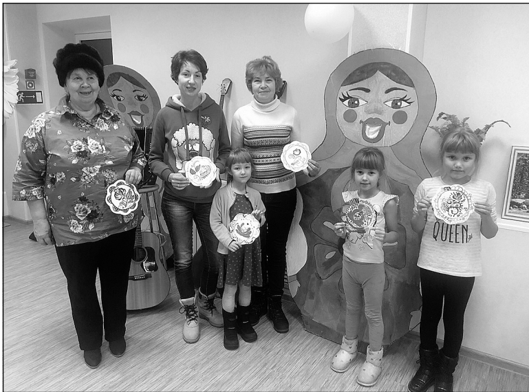
«Ночь искусств» в Успенке.