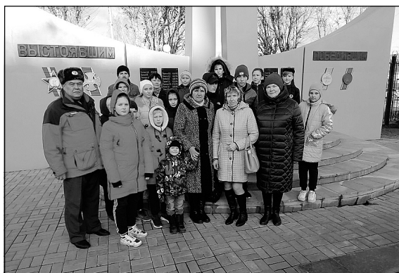
Школьники из Нариманово на территории МЧС России по Тюменской области.

Петр ВАСЕЧКИН. Фото Наримановской средней школы.