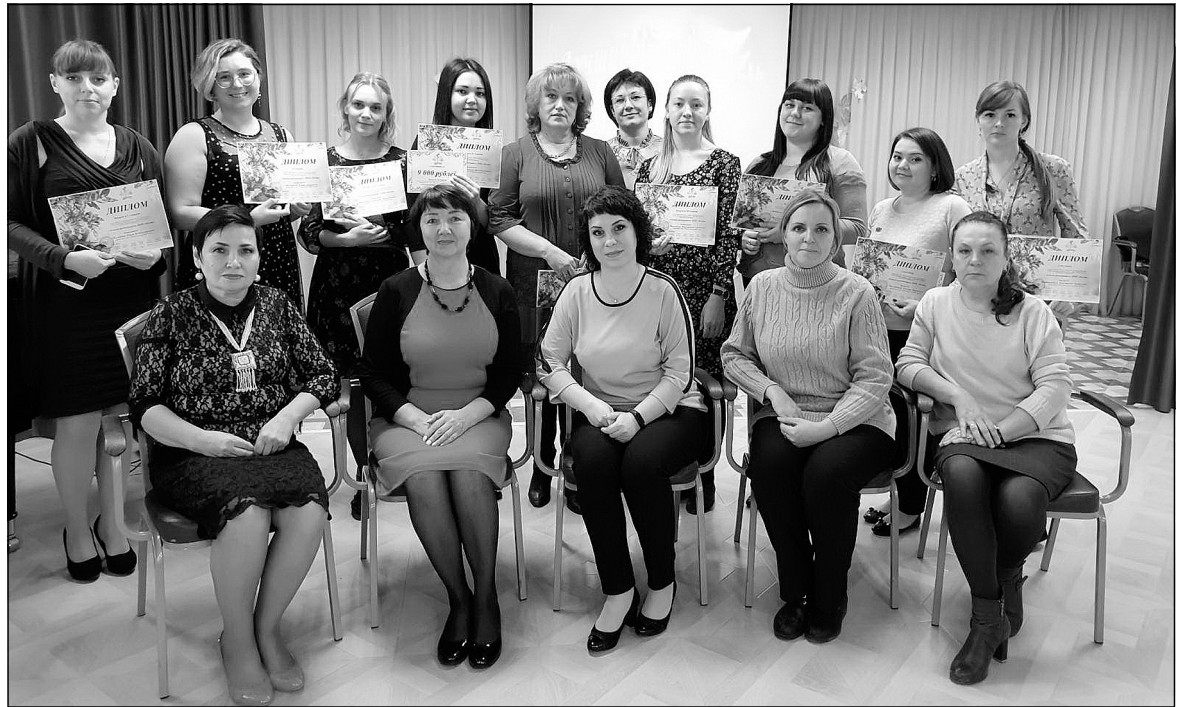
Участники конкурса и его организаторы.