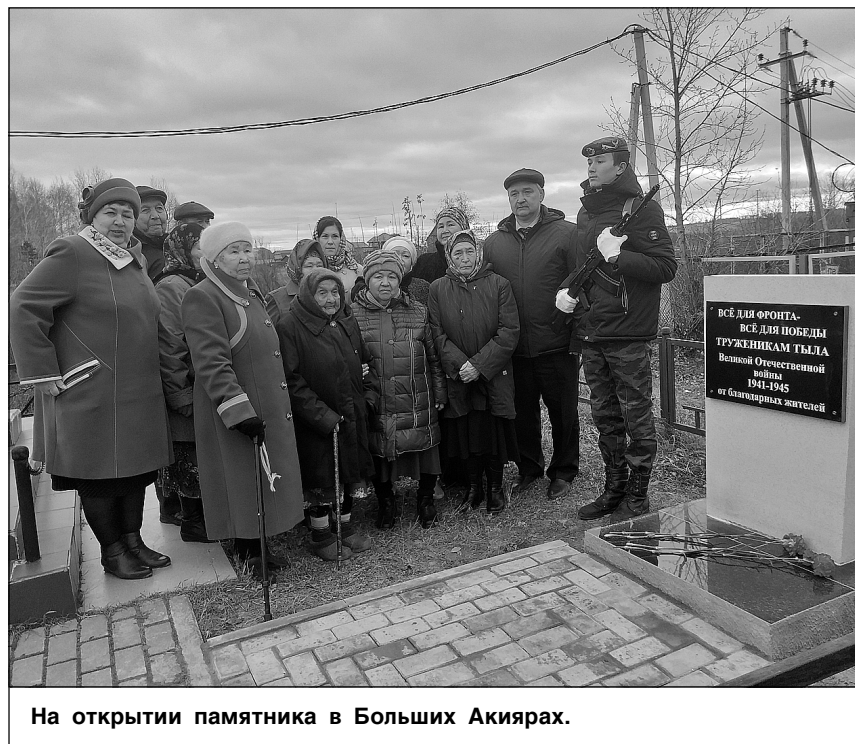
На открытии памятника в Больших Акиярах.

В Больших Акиярах открыли памятный знак, посвященный труженикам тыла.