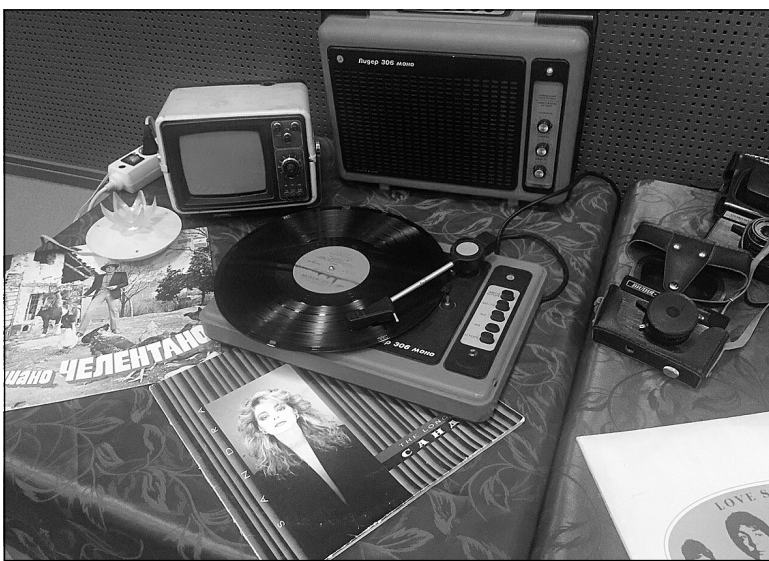
Червишево: играет старая пластинка...