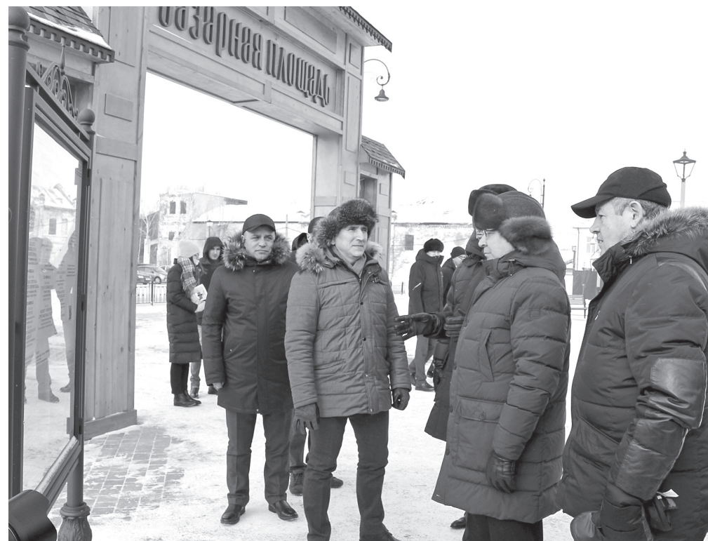
У центральных ворот Базарной площади Владимиру Якушеву представили план проделанного благоустройства

Следующим пунктом пребывания в Тобольске полпреда президента РФ в УФО Владимира Якушева стали Базарная площадь и улица Мира