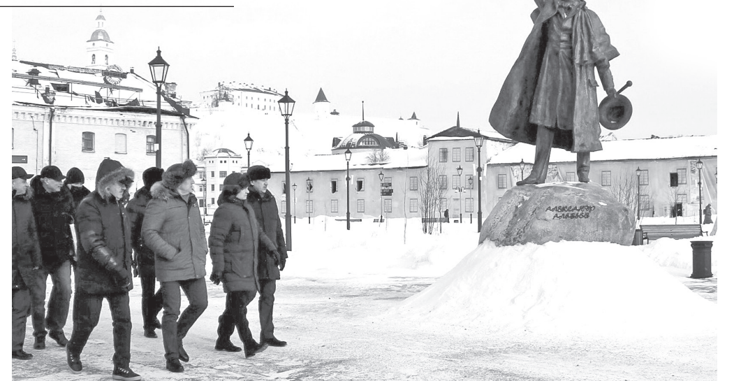
Полпред президента рад был увидеть памятник Алябьеву в сквере на Базарной площади