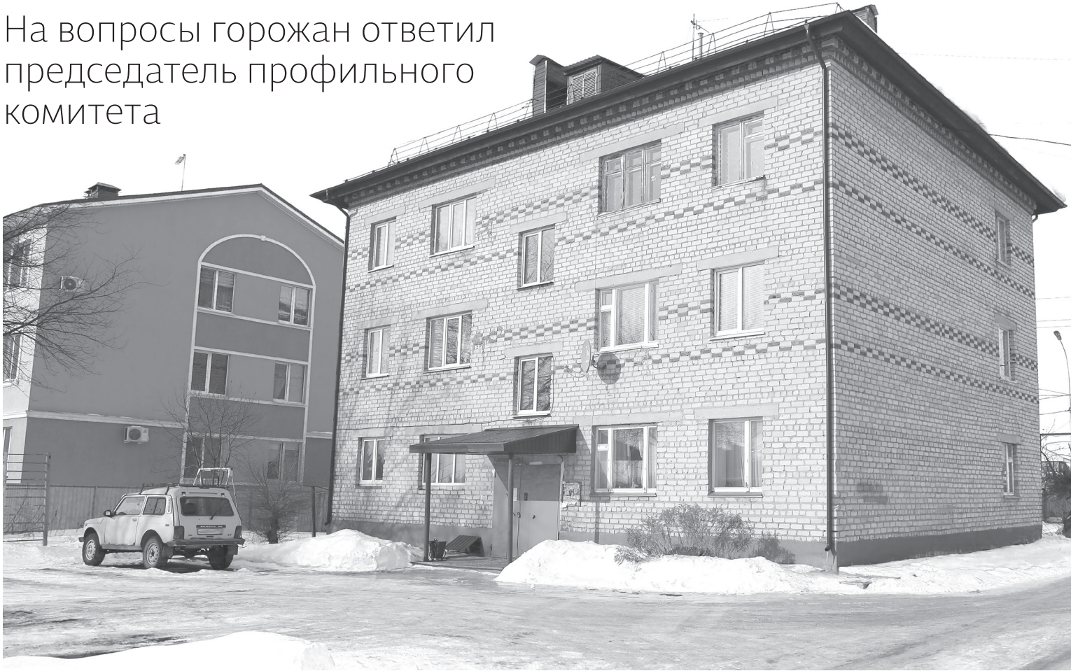
Владельцы квартир дома 26 на ул. Свободы посетовали на плохую уборку двора от снега и отсутствие уборщицы

На вопросы горожан ответил председатель профильного комитета