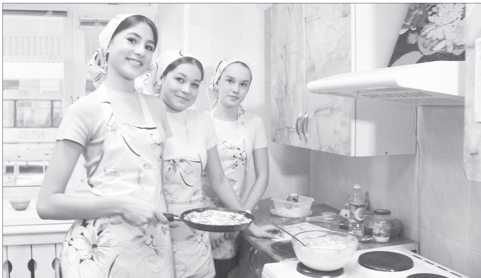
Обстановка в кабинете труда для девочек напоминает кухню в обычной квартире

В школах города третий год проводят уроки блиноведения