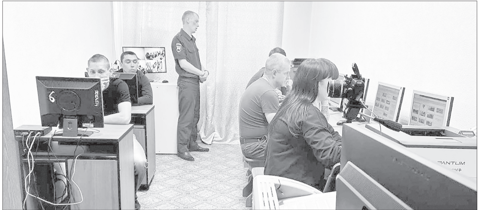
В экзаменационном кабинете ялutorовского отдела Госавтоинспекции проходит теоретическая часть аттестации, а также оформление водительских удостоверений

Основные изменения в сдаче экзаменов и замене удостоверений