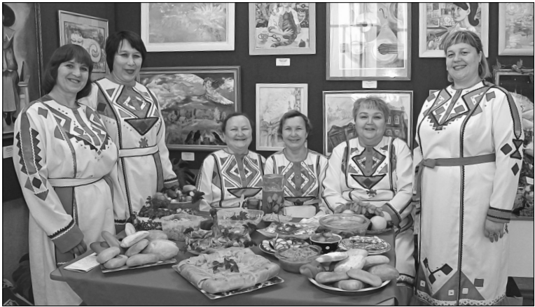
Участницы ансамбля «Пике» из Заводоуковска привезли с собой чувашские национальные блюда

Девушки в народных костюмах, улыбаясь, встречали каждого, кто заходил в этот день в Медведевский сельский дом культуры, повязывали на руку оберег. Небольшая заминка в ожидании гостей из областной центра – путь не близкий – была вскоре заполнена задорными частушками. Первые звучали на чувашском языке, ведь отмечали областной национальный праздник осеннего богатства – «Кёр пуйанлахе».