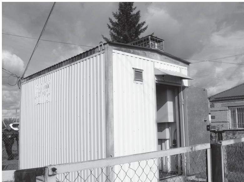
В неприметном, на первый взгляд, здании и расположенной рядом с ним опоре (справа) размещено самое современное оборудование для выхода в интернет

«За четыре года, прошедших с начала реализации программы в Тюменской области, специалисты нашей компании проложили более 1360 километров волоконно-оптических линий связи, – отметил, выступая перед участни-