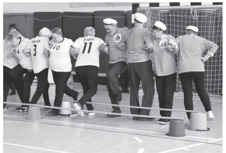
Команда «Бригантина» на «Веселых стартах»