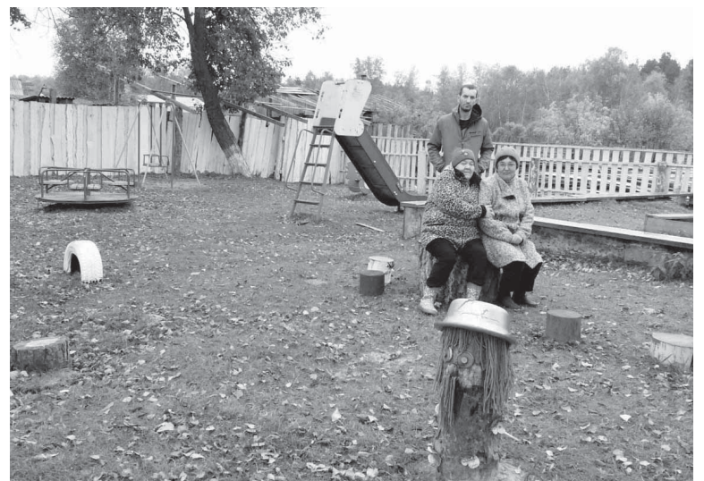
Жители Петропавловки самостоятельно инициировали постройку детской площадки

Большую помощь жителям деревни оказала местная пиломатериала ООО «Мария», руководство которой выделило стройматериал для забора и столбы для турников. На собранные петропавловцами средства был приобретен необходимый спортивный инвентарь для создания веревочного парка. Администрация Щетковского сельского поселения выделила лакокрасочные материалы для обновленного объекта. В целом, местные жители приложили немало усилий для организации досуга ребятни на свежем воздухе. Кстати, не остались в стороне от общего дела и сами юные жители деревни – они помогли взрослым, чем могли.