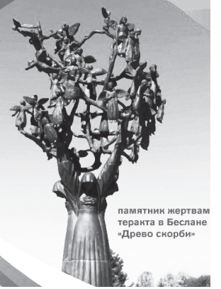
памятник жертвам теракта в Беслане «Дерево скорби»

ДЕНЬ СОЛИДАРНОСТИ В БОРЬБЕ С ТЕРРОРИЗМОМ