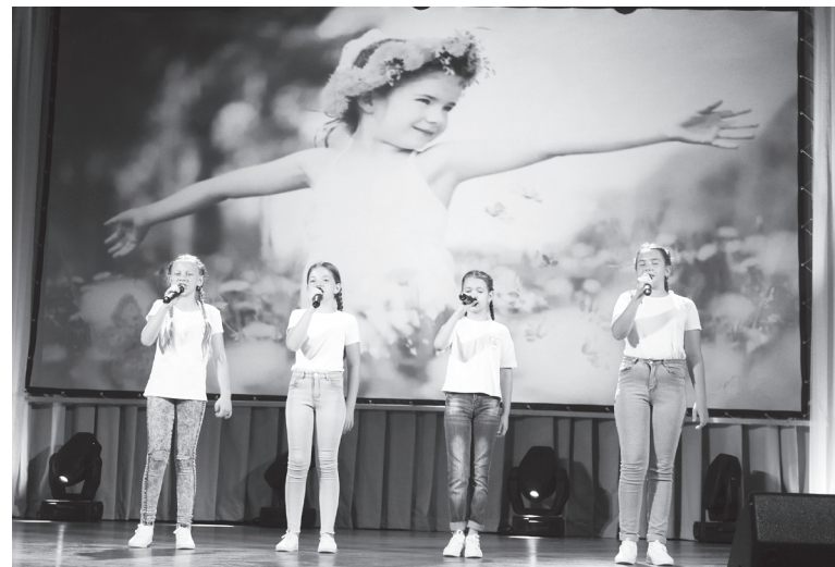
Номера художественной самодеятельности дарили педагогам дети