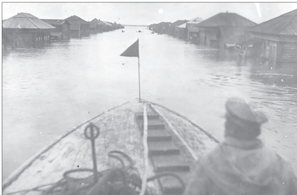
Половодье в селе Большое Тихвино в мае 1941 года

«О войне много разных рассказов, Каждый фильмы смотрел и читал. И непросто ответить так сразу, Что тогда наш народ испытал. Кто остался в деревне и в поле? Мужики далеко, на войне... Невесёлая женская доля: Вместо хлеба - набор трудодней. Женской силой, трудоом ребятишек Поднимались и жались хлеба, Чтобы сдать всё зерно и излишки. - Что же делать? Терпите. Война...»