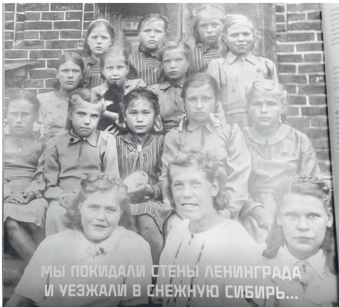
Дети и взрослые из города на Неве на время стали сибиряками. Воспитанники Суерского детдома. Фото сделано приблизительно 9 мая 1945 г.