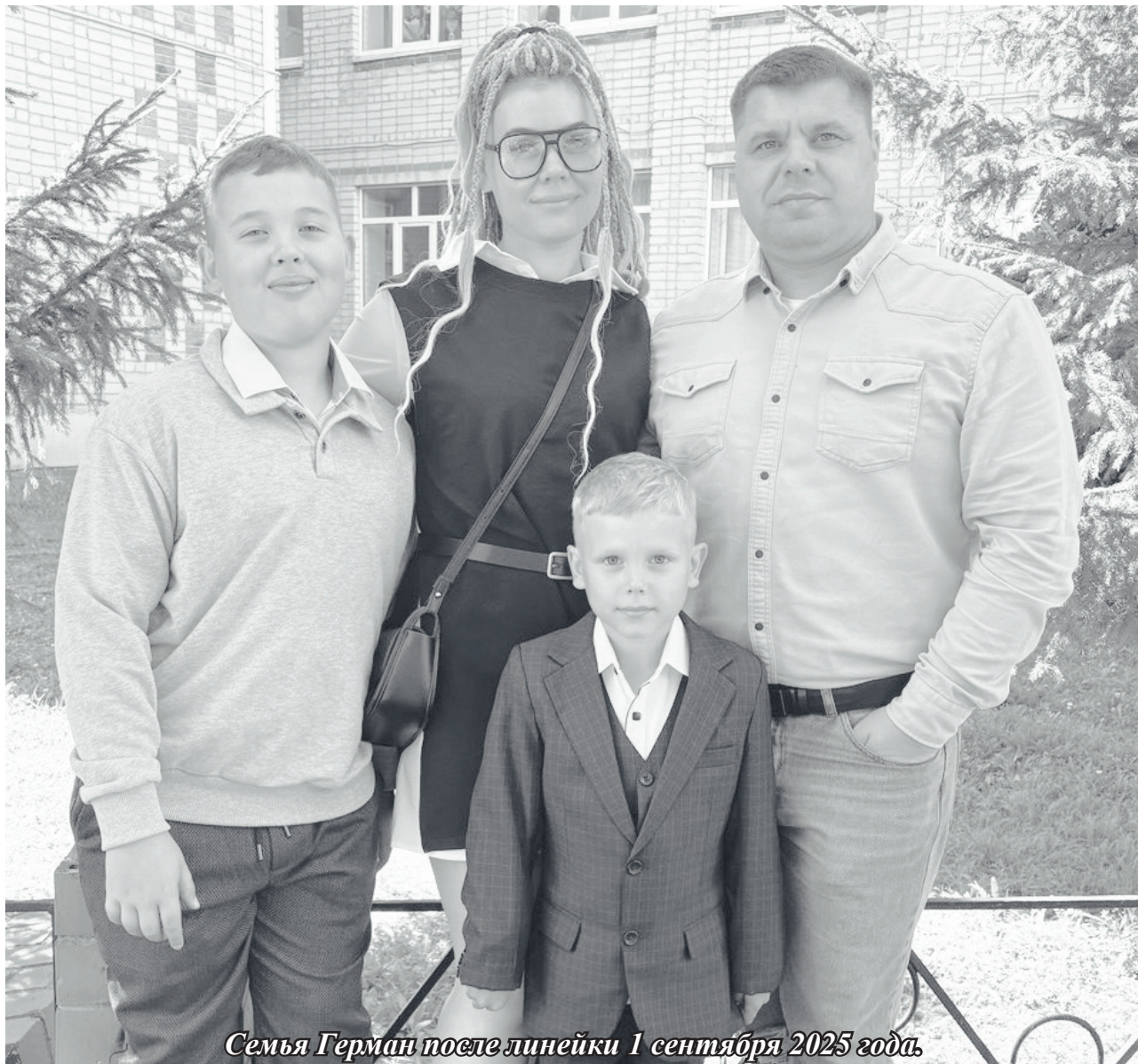
Семья Герман после линейки 1 сентября 2025 года.