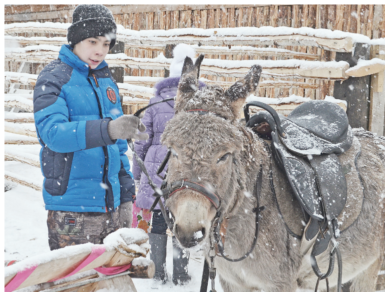
Какое это удовольствие – прокатиться верхом на ослике!