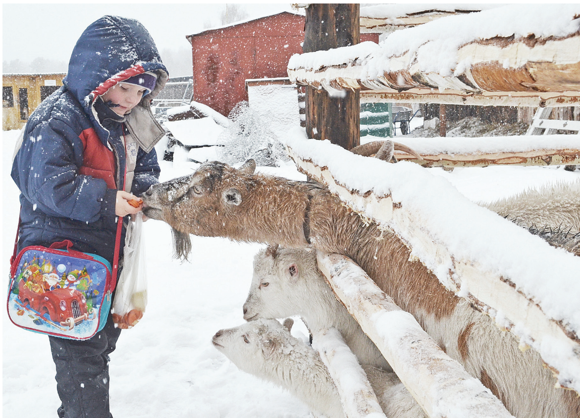
Животные казачьего подворья удостоены особого внимания юных туристов.

Казаки не были бы казаками, если бы не славились своим хлебосольством. Может быть, и не совсем традиционное блюдо для них плов, но каким он вкус-