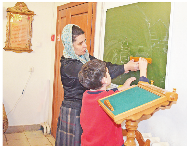
Всё в православном центре, как в настоящей школе, даже школьная доска есть.