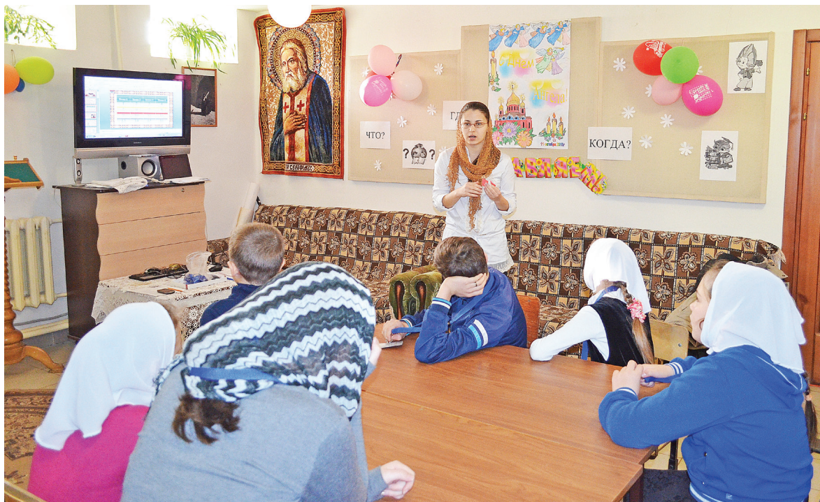
Так выглядит учебный православный класс, здесь дети не только слушают наставления и познают науки, но и интересно проводят досуг.