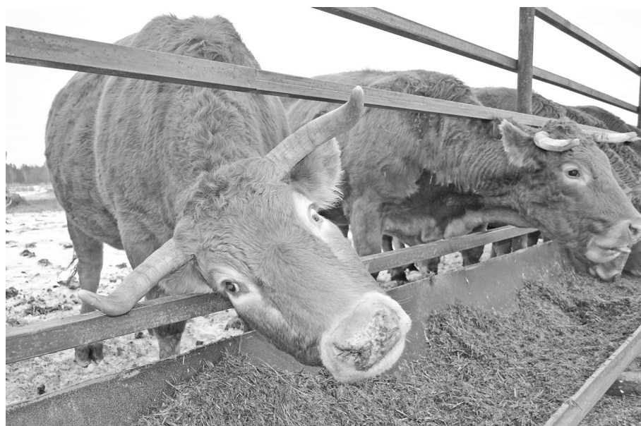
Обед должен быть по расписанию.

Этот скот обладает высокой интенсивностью роста, в раннем возрасте даёт максимум зрелой говядины высокого качества. В туше мало жира, мясо очень нежное, тонковолокнистое, с не-