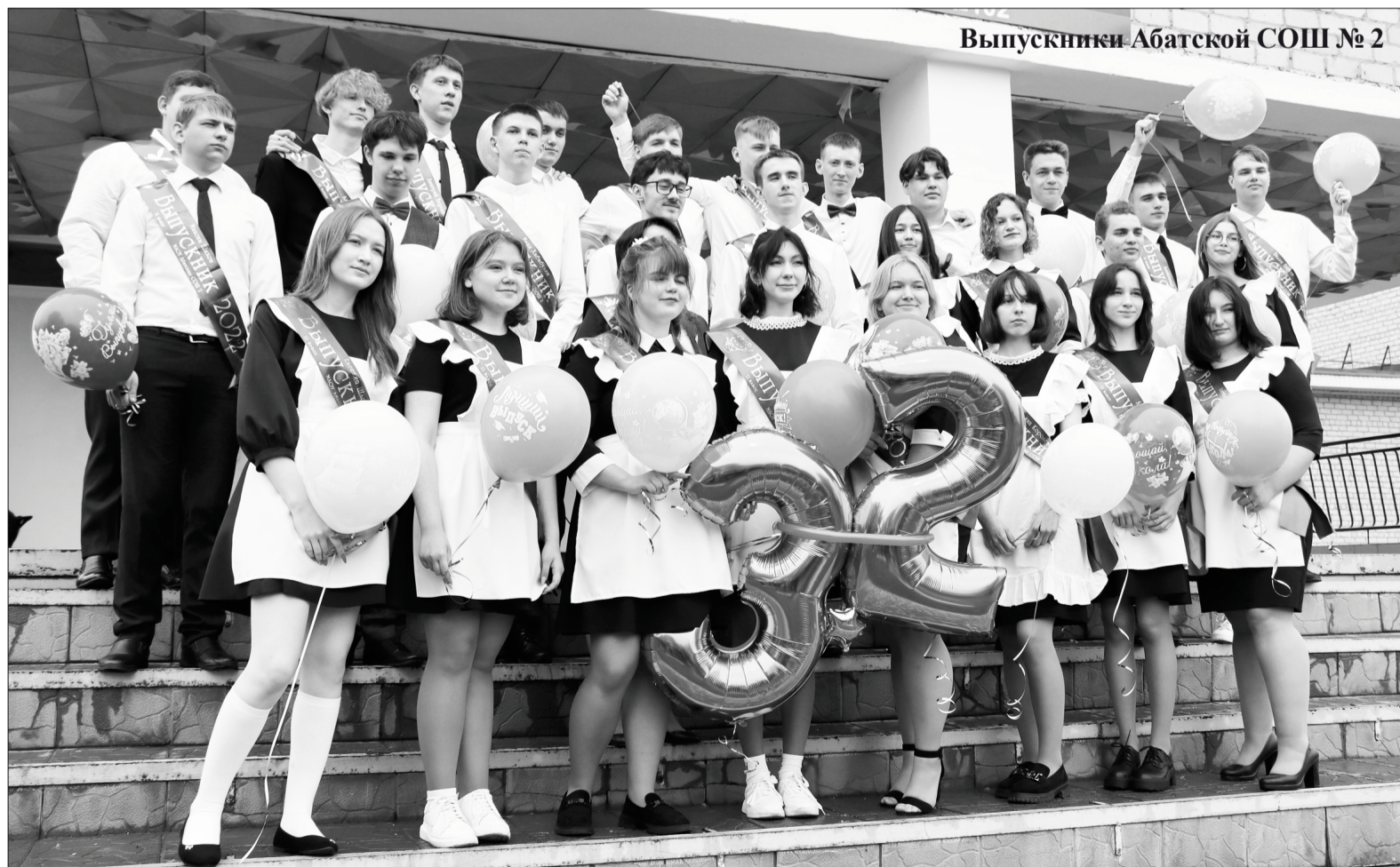
Выпускники Абатской СОШ № 2