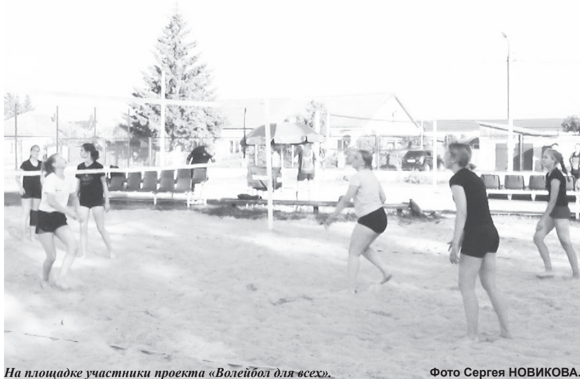
На площадке участники проекта «Волейбол для всех».