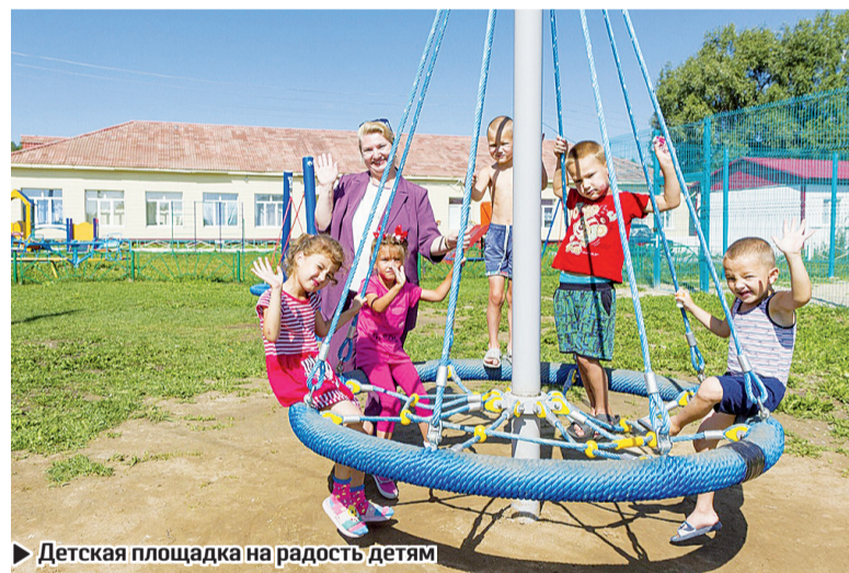
Детская площадка на радость детям