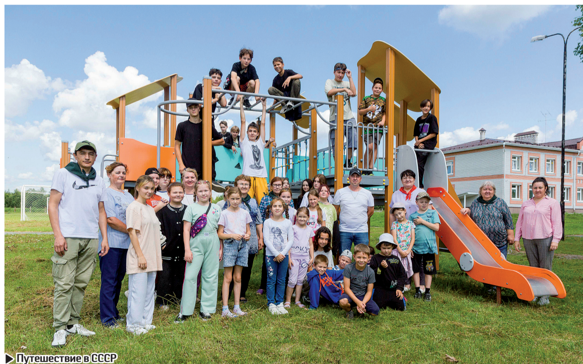
► Путешествие в СССР

Хорошо потрудились отряд главы. За смену ребята на улицах