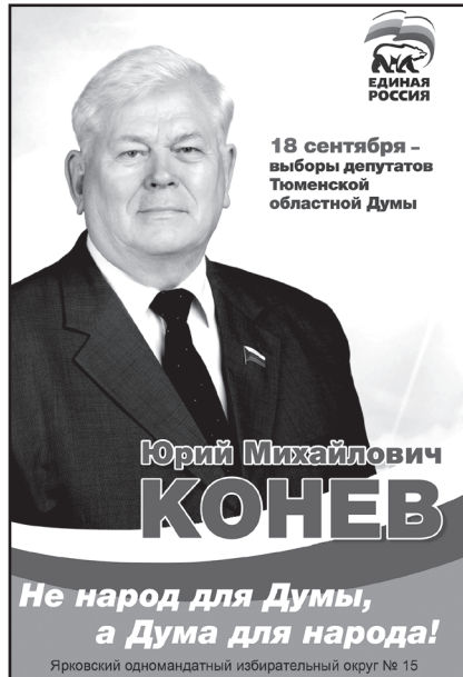
18 сентября – выборы депутатов Тюменской областной Думы

Как известно, за последние годы в Тюменской области проведена большая работа в плане социально-экономического развития сельских территорий. Но и нерешённых вопросов, к сожалению, ещё немало. Причём, касаются они не только Юргинского района, но и других муниципальных образований. На первое место бы поставил проблемы сельских дорог. В областном центре, как известно, они регулярно ремонтируются, расширяются, активно строятся современные транспортные развязки. А вот на селе перемены к лучшему, к сожалению, практически нет.