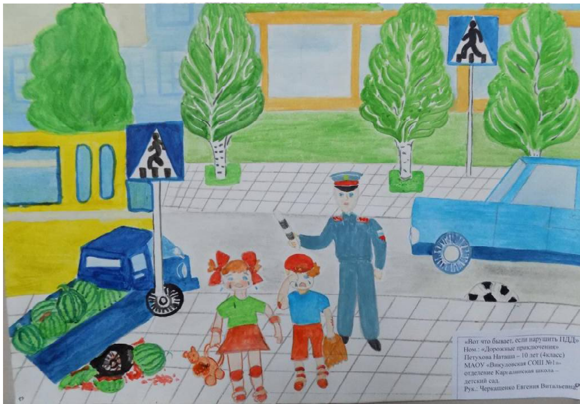
» «Вот что бывает, если нарушить ПДД», работа Натальи Петуховой

Традиционно в Викуловском центре творчества прошёл конкурс рисунков по Правилам дорожного движения «Безопасные дороги – дороги в будущее»