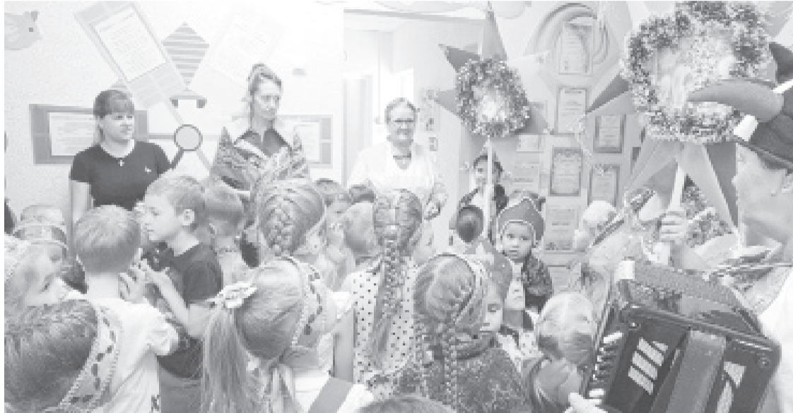
|| Фото из архива детского сада «Ивушка»

Малыши расширили своё представление о культуре, обычаях и традициях русского народа, а также получили сладкие подарки.