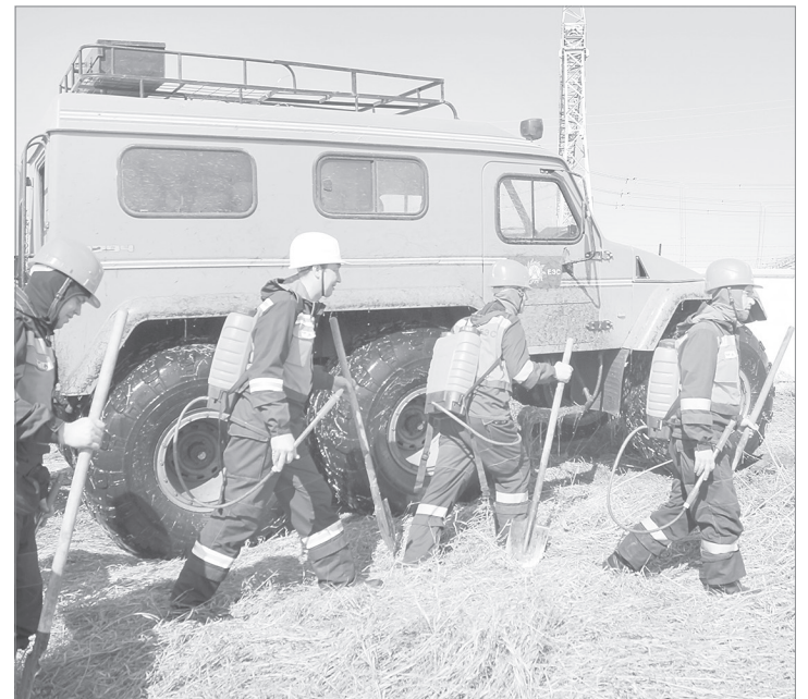
Светлана НЕЧАЕВА /фото автора/

Тактико-специальные учения по ликвидации пожара на специальном объекте энергетического комплекса прошли на подстанции «Беркут 500».