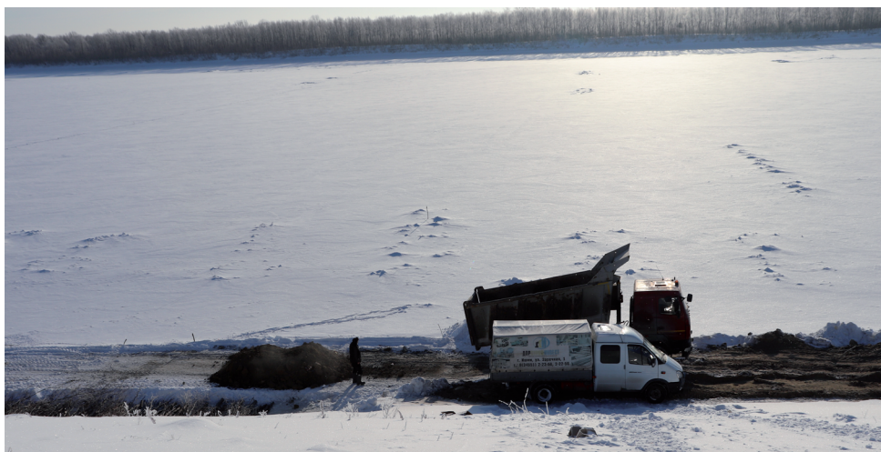
Идёт обустройство подъездного пути.