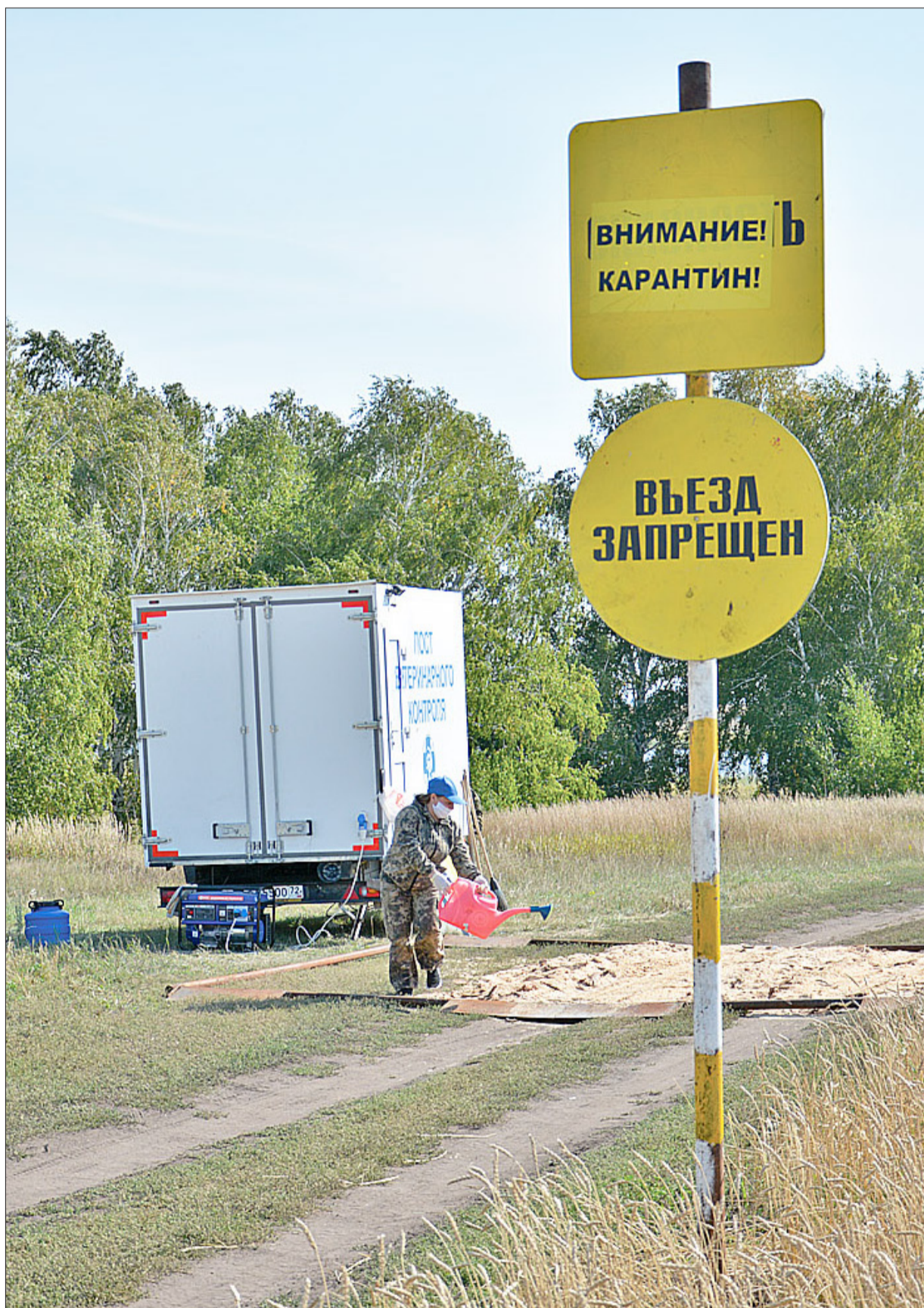
В зоне карантина развёрнут пост ветеринарного контроля

В Казанском районе зафиксирован очаг вирусного заболевания птиц