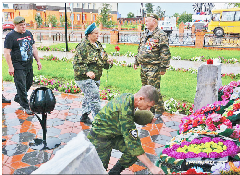
Возложение цветов к памятнику – дань уважения погибшим боевым товарищам