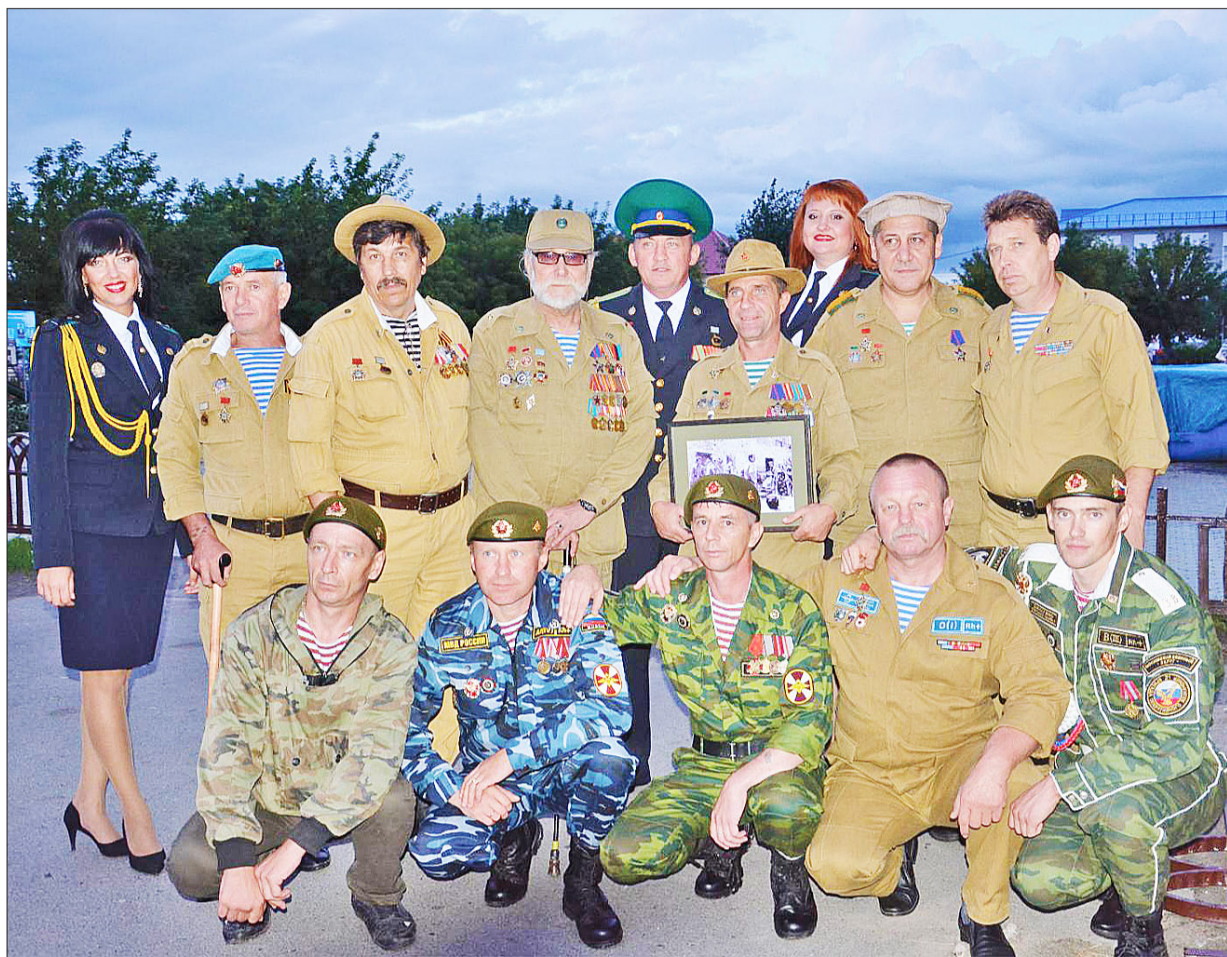
Участники V всероссийского фестиваля. 2017 год

Наверное, самым волнующимся и запоминающимся моментом в фестивале было выступление московской легендарной группы «Каскад». Не в каждом городе, а уж тем более